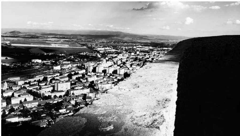
Látkép a városra „magos” Déva várából

Konklúzióként leszűrhetjük, hogy a szemléletében sok újítást tartalmazó, a nemzetközi tudományosságba jól beágyazódó kötet egyértelműen szemlélteti a megújulásra való törekvést. A könyv elején Vlad Andrei Lăzărescu a kontinuitást kapcsán bátor és megalapozott kritikája alapján pedig méltán nevezhető Radu Popa, Lucian Boia nyomán a román régészet, illetve történetírás „úttörőjének”.