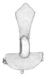
A 4. század divatja klasszikus elemének, a félköröngös fejű lemezfibulának Erdélyi-medencei elterjedése; illetve a tekerőpataki félköröngös fejű ezüst lemezfibula (Kapcsos Norbert rajza)

az összefüggés a népnév és a hatalmi struktúra között, a szerző sajnálatosan nem foglalkozik. Illetve azzal sem, hogy mi is a nép – jogi-politikai-kulturális szempontból. Az igaz, hogy a Kis-Szamos vidékétől egészen a Dnyeszterig a 4. század második felétől egy egységes anyagi és temetkezési kultúra jelenik meg, mindezt azonban egy „nép” számlájára írni igazolhatatlan terminológia, amelyhez szerzőnk helyenként (például a 100. oldalon) – de nem általánosan – kritikusan is viszonyul.