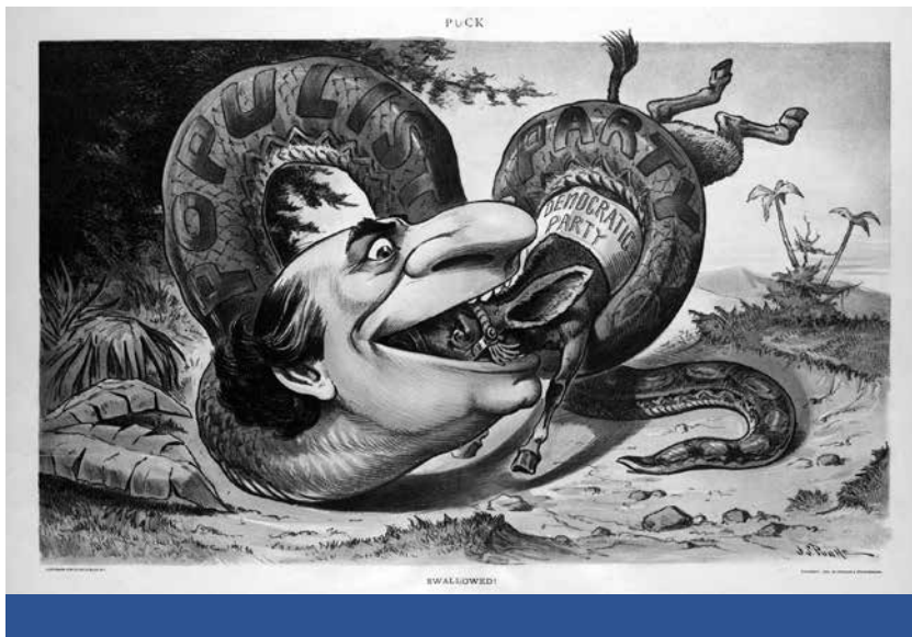
Ellenelit – William Jennings Bryan Populista Pártja lenyeli a Demokrata Pártot (John S. Pughe, 1900)

Coughlin 1934-ben megalapította a Társadalmi Igazságosság Nemzeti Unióját. 27 A Coughlin-jelenség azért jelentős, mert bevitte a populista stílust (de nem magát a régi populizmust!) a munkásság és az alsóközéposztály körébe. Coughlin a háború alatt elszigetelődött, korábbi befolyását soha nem nyerte vissza. 28 A médiapap sorsa mutatja, hogy az 1930-as évek válsággal telített levegőjében a baloldali indíttatású populizmus és a szélsőjobboldal találkozhatott a társadalmi problémák talaján, ám a New Deal kifogta a szelet az ilyen egy személyes próbálkozások vitorlájából. Ennek a fajta, coughlini populizmusnak semmi köze nem volt – a népre való hivatkozáson kívül – a farmerpopulizmus tiszteletre méltó hagyományához. Ez már csak stílus volt.