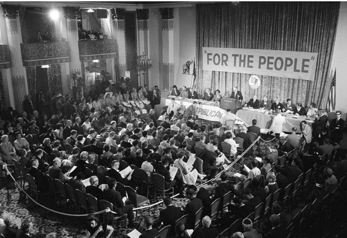
A nép pártján – Republikánus nemzeti konvenció 1964 júliusában

azt államtalanítani kell.” 1 Ez az anarchisztikus-libertárius felfogás a hatalmat elvonná az államtól, de az uralom struktúráit továbbra is üzemeltetné, mégpedig kevésbé látható és elszámoltathatatlan globális szerveződések (transznacionális vállalatok, nemzetekfölötti intézmények, föderális bíróságok, NGO-k) segítségével. Az ilyen és ehhez hasonló, naivan utópikus elképzelések mellett persze sokkal átgondoltabb elméletek és nemritkán fölfegyverzett gyakorlatok is léteznek a politika megsemmisítésére vonatkozóan; amelynek első lépése a jobb- és a baloldal közötti különbség eltagadása, semlegesítése és feloldása szokott lenni. De a semlegesség nem semleges, az ideológiamentesség maga is ideológia.