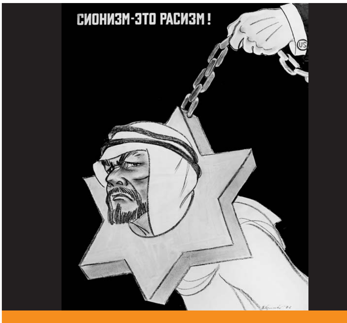
Szovjet antiszemitizmus – Joseph Efimovsky: A cionizmus rasszizmus (1976)

előtti napokban – Cvi Perez bécsi rabbi és cionista vezető a Vigadóban előadást tartott a cionizmus nemzetközi helyzetéről, egy zsidó származású szociáldemokrata a Vörös Gárdát küldte ki a gyűlés felosztatására. A Magyar Zsidó Szemle utoljára 1919. március 14-én jelent meg, s március 21-e után az MCSZ is felfüggesztette működését.