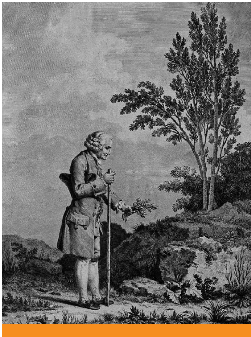
Magányos sétáló – Rousseau, a botanikus (Österreichische Nationalbibliothek)

csak azt valósította meg nagyban, amit 1789-ben a francia nemzetgyűlésben deklaráltak, Voltaire II. Nagy Frigyes levelezőpartneréül szegődött, II. József pedig, mintegy előremenekülve, forradalom nélkül valósította meg a forradalom célkitűzéseit. E „forradalom felülről” népi ellenállást váltott ki, amely adott esetben tiroli parasztfelkelésként és magyar nemesi ellenállásként jelentkezett.