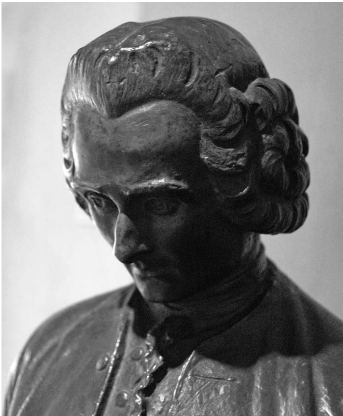
Vízválasztó – Jean-Jacques Rousseau (1712–1778) mellszobra egykori, Les Charmettes-i (Svájc) lakhelyén

dozók (John Stuart Mill, Tocqueville, John Rawls) legszívesebben megkerülték volna életművét, hogy a két eszme közötti, általa vont határ elmosódjék.