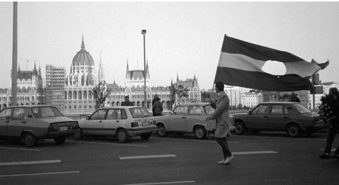
1989 – Az '56-os forradalomra emlékezők vonulnak a Bem rakparton 1989. október 23-án

magyarországi befolyásszerzésének; cserében pedig járt a „politikai menlevél”, jöhettek az üvegyöngyök a nómenklátúra-közeli vállalkozók kisebbségi tulajdonrészei, felügyelőbizottsági helyei és tanácsadói kinevezései, kedvezményes ingatlanüzletei formájában.