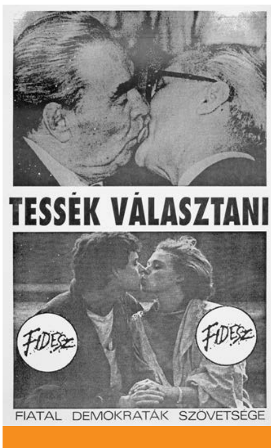
A Fidesz választási plakátjai 1990 tavaszán (Terror Háza Múzeum)

ség mára elveszítette hegemon szerepét, és részben kikerült a zsűri szerepéből, ahonnan előszeretettel ítélkezett (és ma is ítélkezik) a demokratikusan választott politikai vezetők, sőt maguk a választók felett is.