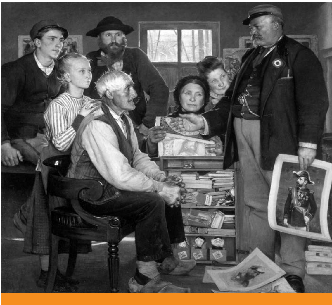
Elitellenesség – A Boulanger-kampány ábrázolása Jean-Eugène Buland Propaganda című 1889-es olajfestményén

koznak az állampolgárokéival, akik szemében a politika leértékelődik, és a politikusok cselekedetei irrelevánsnak, ha ugyan nem károsnak tűnnek számukra.