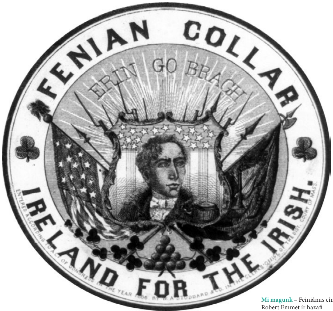
Mi magunk – Feiniánus címke Robert Emmet ír hazafi arcképével, 1866 (Library of Congress)