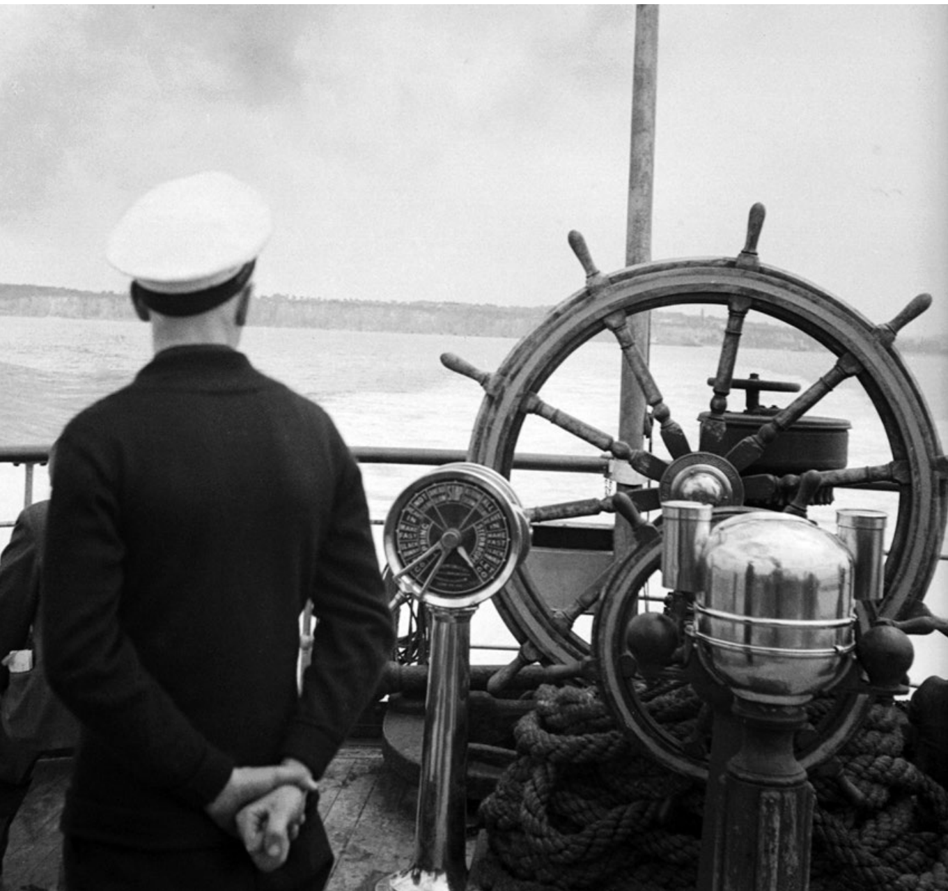
Kormányzástudás – A La Manche csatorna Dover előtt, 1939

erősített meg, drámaian átalakul. A mai hasonlít az 1815-ös bécsi kongresszus utáni világhelyzetre, amelyet versengő nagyhatalmak határoztak meg, de immár békét biztosító Szent Szövetség és nagyformátumú Metternichék, Talleyrandok nélkül. 2) Vége szakadt a neoliberális kurzus magabiztosságának, amely egyszerre jelentette a piaci fundamentalizmust és az államtalanítás gyakorlatát. A washingtoni konszenzus neoliberális hegemoniája a szemünk előtt repedezik, amikor privatizáció helyett az állam gazdasági szerepének visszatérését és protekcionizmust, szabadkereskedelem helyett védővámokat és gazdasági háborúskodást látunk. Mindez abba a világfolyamatba illeszkedik, amelyet a globalizáció megtorpanása, szerkezetének megroppanása és számos deglobalizációs jelenség kísér, aminek a nemzetközi szervezetekkel és egyezményekkel kapcsolatos szkepticizmus csak az egyik vonása. 3) Idehaza az 1990 és 2010 közötti posztkommunista korszak végét regisztrálhatjuk, amelynek bár gazdasági-politikai hegemoniája megszűnt, a szervesen hozzátartozó szívós liberális kulturális hegemonia viszont még fennáll. – Ebben a(z inkább) kedvező nemzetközi környezetben releváns a kérdés, hogy Magyarországon korszak lesz-e a rendszerből?