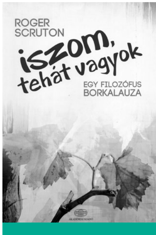
Iszom, tehát vagyok (2009 [2011])

Olvasunk és használjuk a könyveit, adjuk kölcsön barátainknak őket és vitassuk meg a gondolatait. Adóssai vagyunk a szerzőnek – ne gyászoljunk hát sokáig, hanem kezdjünk el törleszteni! ■