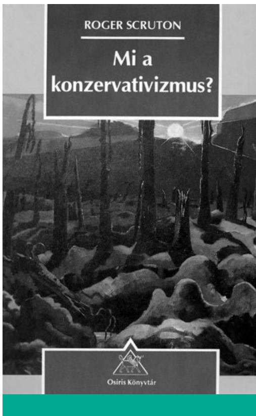
Mi a konzervativizmus? (1995)