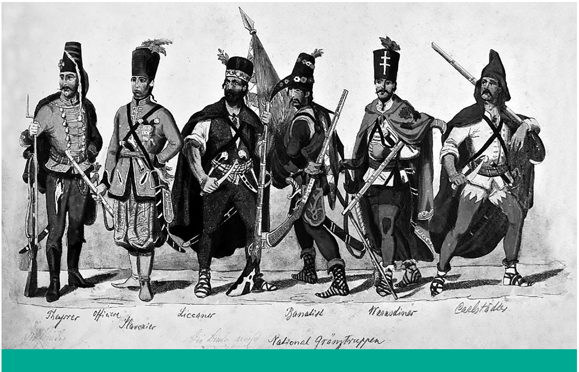
Határvédők – A Habsburg-birodalom nemzeti határvédő erői, 18. század vége

a brüsszeli ragadozó bürokrácia befolyásának korlátozása érdekében. Ráadásul a nemzeti bankok és az alkotmánybíróságok álláspontjai is különösen veszélyes rákfenének bizonyultak. A külföldiek által kikényszerített úgynevezett „független ügynökségekkel” [„civil” és nemkormányzati szervezetek – a Szerk.] karöltve, amelyeket mindenütt saját embereikkel tömtek tele, mindez egy párhuzamos hatalmi rendszerré épült ki, amely nemcsak ellenáll az emberek demokratikus akarátának, hanem közvetlenül szembe is száll azzal, miközben óvja az amerikai Federal Reserve, a pénz- és hitelintézetek, a korporációk, valamint más nemzetközi lobbik (mint amilyen például a Bilderberg-csoport is) érdekeit. Ezért a demokratikus szuverenitás visszaszerzéséért folytatott küzdelem megköveteli azon központi bankok és az alkotmánybíróságok munkájának és beavatkozásainak korlátozását, amelyek megsemmisítettek minden reformtörvényt, és támogatták saját államaik eladósodását. Röviden: a szuverenitás és a demokrácia helyreállítása az új konzervativizmus megújításának és gyakorlásának feltételévé vált.