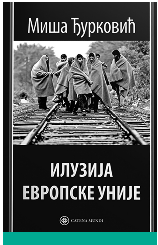
Miša Đurković: Az Európai Unió illúziója (2015)