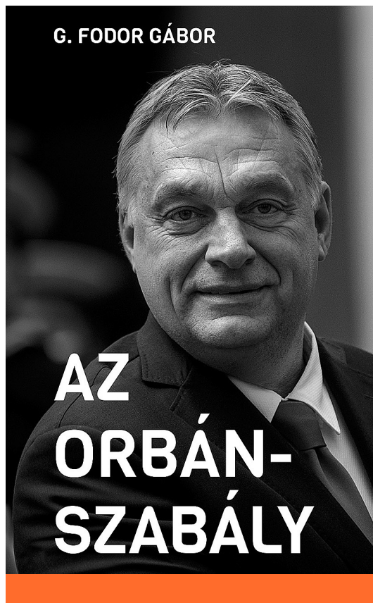
G. Fodor Gábor: Az Orbán-szabály

A könyvet olvasva kibontakoznak előttünk a rendszerváltoztatás harminc évének már-már felét domináló Orbán Viktor gondolkodási logikájának törvényszerűségei (ezek az ún. Orbán-szabályok), amelyek „a politikai tudás foglalatjaiként” szolgálnak. Ezek az új szabályok kilógnak a sorból, felfordulást okoznak a régi rend számára, ezért eretnek (= aki nevének nevezi a dolgokat)