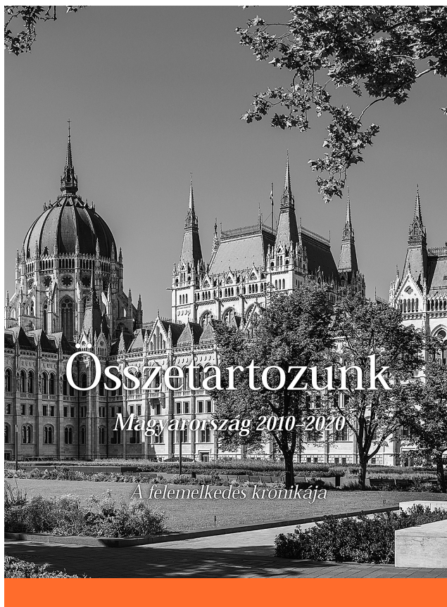
Összetartozunk – Magyarország 2010–2020

S ha már gazdaság, akkor jól érzékelhető, hogy a nagy, nemzetközi cégek érdeklődésének fókuszába került az ország. Több okból is. Az egyik a biztonsági kérdése. Tudni kell, és a kötet pontosan rögzíti is a bűnügyi adatok évtizedes alakulását, hogy 2010 és 2019 között több mint felére csökkent a regisztrált bűncselekmények száma (egészen pontosan 447 186-ról 165 648-ra). Tűnjék bármennyire is furcsának, de például a Debrecen iránt érdeklődő külföldi befektetők első kérdései között szerepelt a város közbiztonsága. A jelek szerint sokat számít az is, mert ez szintén biztonsági kérdés, hogy Magyarország önálló és határozott lépéseket tett az illegális migráció ellen, fizikai és jogi értelemben egyaránt. Vállalva a nyugati világ és a hazai balliberális politikai tömb minden kritikáját. Nem túlzás azt állítani, hogy az elmúlt évtizedben Magyarország, élén kormányával, a kereszténység védőbástyájává vált ; igaz, már hozzászok-