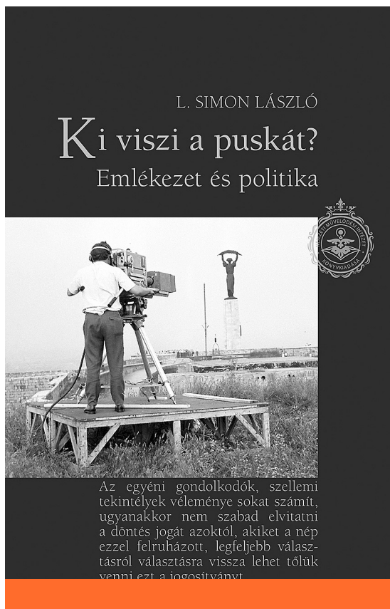
L. Simon László: Ki viszi a puskát? Emlékezet és politika (2020)

Az évtizedes kultúratámogatás krónikája egészen a szakpolitika legalsó – támogatási, finanszírozási, szakigazgatási – szintjéig tárgyalta a könyvben; amikor például a megyei levéltáraknak a Magyar Nemzeti Levéltárba