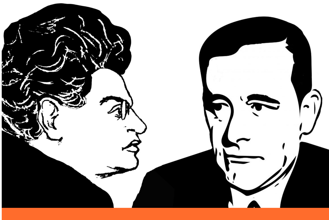
Balról Antonio Gramsci, jobbról Carl Schmitt (A Korunk 1967. évi 7. száma 934. oldalán közölt képének és a thisiscommonsense.org 2018. március 13-ai illusztrációjának felhasználásával)

– egyetértés) pedig az integráció, a hegemonia és a kompromisszum szavával válja föl. 10