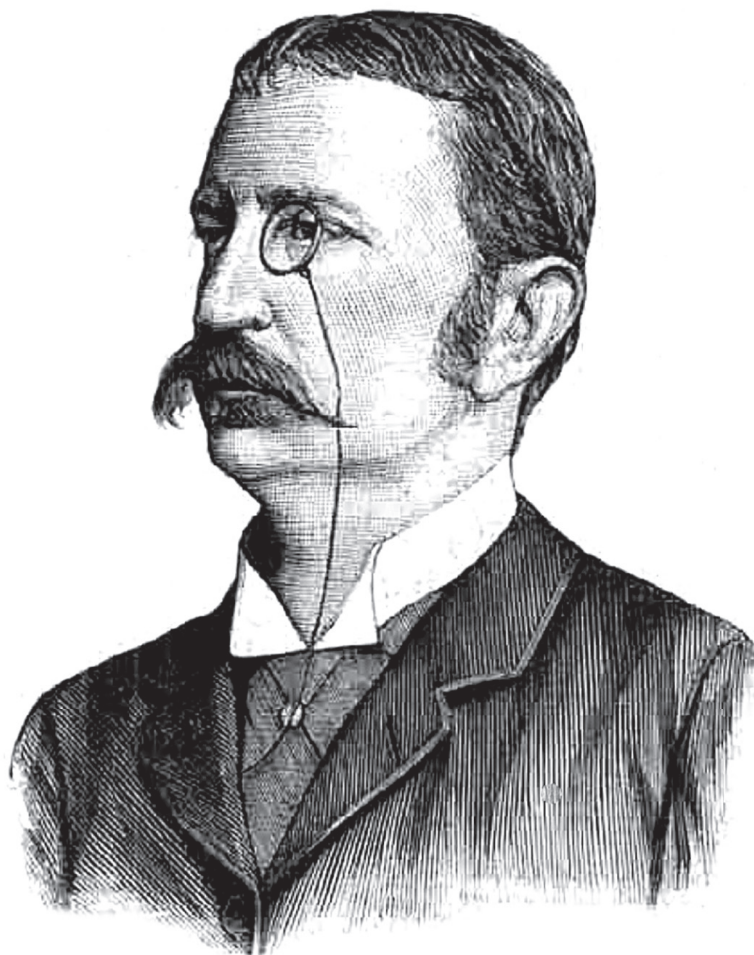
Asbóth János (1845–1911) mint az 1887–92-es Képviselőház tagja (Ellinger Ede fényképe után készült rajz) ( Vasárnapi Újság , 1888. 51. szám, 833. oldal)

nyeznie, s e folyamat „csakis az egyenlő műveltség alapján képzelhető”. Asbóth jelzi: ezalatt természetesen nem a tudományos műveltség, hanem a „társadalmi műveltség, a modor műveltsége” értendő. 9