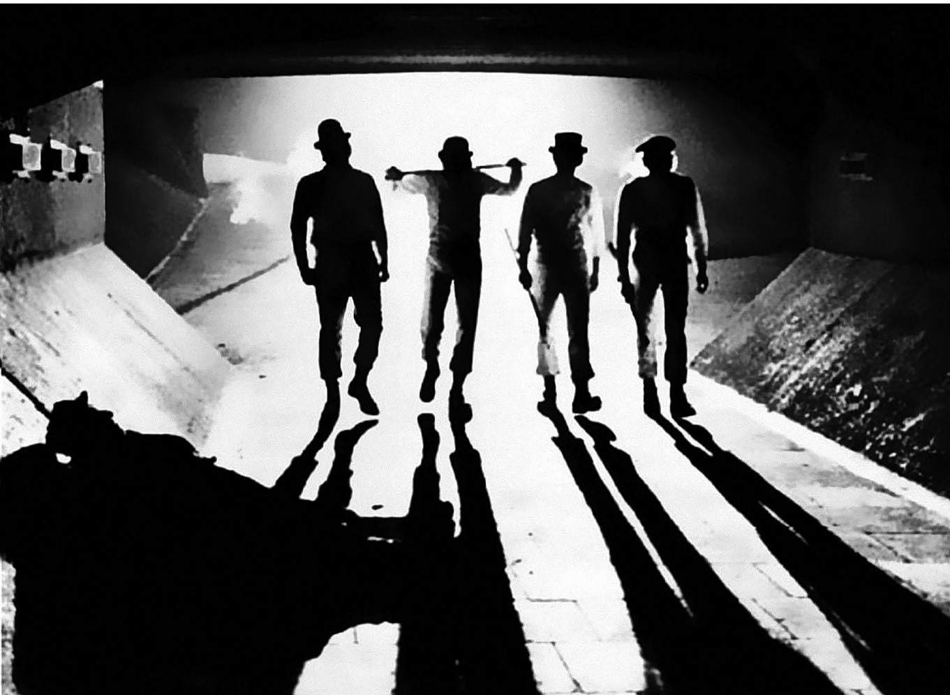
Harci szövetség – Jelenet a Mechanikus narancsból (rendezte Stanley Kubrick, 1971)

oppozíciójára épül. A családfői szerepre berendezkedett férfi valójában olyan „juhászkutya”, akinek egyetlen komoly feladata van: a feleség és a gyermekek anyagi biztonságának védelme. Mindeközben fokozatosan feladja az alapvető férfierényeket; a „biztonságos otthon” nyújtotta kényelemnek köszönhetően idővel elhjasodik, és egyre inkább a feleség befolyása alá kerül. Ha némelykor meg is próbál szembeszállni a női dominanciával, a végén rendszerint papucs-hósként lepleződik le. A juhászkutyaival ellentétben, a vadonban élő farkas már a társadalomból elűzött barbár férfit szimbolizálja. Az ilyen „farkas-ferfi” számára a nő elsősorban győzelmi trófea, és ebben a világban a megszerzett nőstény védelme, miként Simon Volpers megjegyzi, „korántsem a nagyrabecsülést vagy a szeretetet kifejező aktus, sokkal inkább egyfajta presztízsgyőzelem a férfiaságot konstituáló rendben.” 9