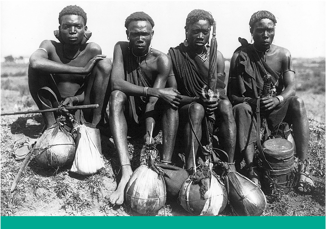
Nemzetiség – Fialat bantu kikuju férfiak Brit Kelet-Afrikában (ma Kenya) a 19–20. század fordulóján

Elsőként arra a performatív belső ellentmondásra szeretnék rámutatni, ami egyrészt a Donovan által vizionált, zárt, jó esetben is csak néhány száz főt magában foglaló ideális bandakultúra idealizálása, másrészt az amerikai szerző nemzetközi méreteket öltött jelenléte között feszül. Munkáit Amerikában rendre kiadják, lefordítják más nyelvekre, könyvei az internetes könyvkereskedelem révén bárhol megvásárolhatók a glóbuszon. Maga Donovan rendszeres előadója a legkülönbözőbb szélsőjobboldali erők által szervezett kulturális rendezvényeknek, szabadegyetemeknek. 13 Vagyis folyamatosan igénybe veszi annak a globális kapitalizmusnak az infrastruktúráját, aminek mihamarabbi elpusztítását oly kitartóan követeli.