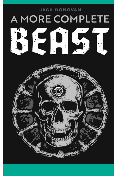
Jack Donovan törzsi trilógiája: A férfiak útja (2012), Csak a barbárok tudják megvédeni magukat (2016), Egy igazi férfi (2018)