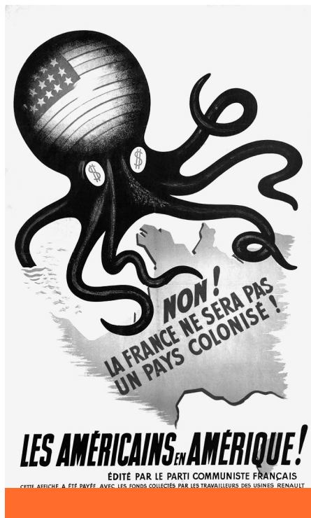
Nem leszünk gyarmat – A Francia Kommunista Párt „Franciaország nem kolónia” feliratú plakátja az amerikai befolyás ellen, 1950 körül

Az Egyesült Államok társadalmi–gazdasági világát emiatt sajátos ideológiának tartja, amely „a képletek képlete, a modellek modellje”, közkeletű nevén az American way of life . Komoly európai társadalompolitikai, sőt történetfilozófiai problémának nevezi, hogy miután „az Egyesült Államok napjainkra kisajátította magának a »nyugati társadalom« fogalmát”, az 1945 és 1989 közötti katonai megszállásnak és kulturális jelenlétének köszönhetően „Nyugat-Európa [...] amerikai befolyás alatt már átalakult egy télosz nélküli társadalommá”. Mindez – a más természetű, szovjetek okozta súlyos problémák mellett – legalább a Vasfüggönytől keletre nem volt jellemző, így Molnár úgy érezte, hogy amikor majd „valódi csatátér körvonalazódik a következő évtizedek látóhatárán az amerikai típusú liberális felfogás, illetve a nemzeti fel-