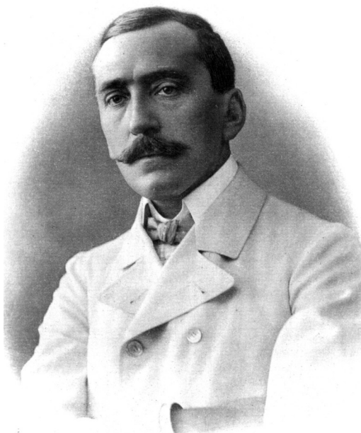
Lapalapítók – Gróf Tisza István és Herczeg Ferenc a századelőn