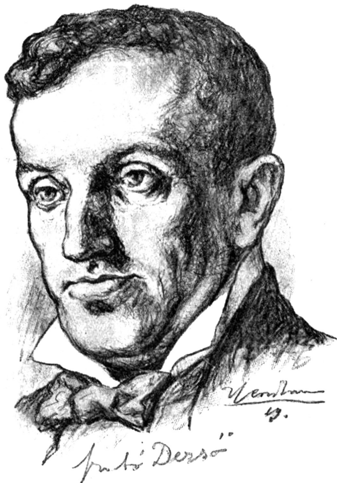
Szociálkonzervatív – Szabó Dezső 1920-ban, mint a Magyar Írók Szövetségének elnöke ( Képes Krónika , 1920. április 20. 414. oldal)

addig is nyomasztónak érezte a régiója, országa helyzetét. A világháború azonban hozzájárult ahhoz, hogy tudatosítsa bennük: önmagában a nyugati (amerikai, nyugat-európai) fejlődéshez való fölzárkózás sem oldja meg a problémákat, hiszen sem a „civilizátor” angol, sem a „kultúrateremtő” német, „szabadságot, egyenlőséget, testvériséget” hirdető francia állam és nép nem volt képes önmaga erejéből véget vetni a vérontásnak.