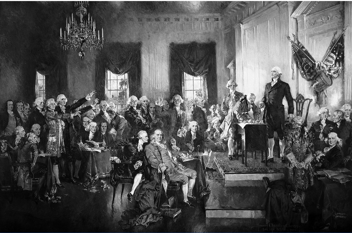
Arisztokratikus köztársaság – Howard Chandler Christy: Az Egyesült Államok alkotmányának aláírása (1940)

anyanyelvűek bevándorlása is. Szinte mindenki azt hangsúlyozza azóta is, hogy az amerikai alapítás részben a Biblia, jórészt a modern természetjogi gondolkodás jegyében zajlott, már ami a politikai eszméket és erényeket illeti. Arról kevesebb szó esik, hogy az amerikai alapítás vezetői közt meghatározóak voltak az arisztokraták, ráadásul az elvek szerint is arisztokratikus jellegű államalapítás volt. Az amerikai alapítók – Jefferson, Madison, Monroe – mind arisztokraták voltak, így feltétlenül igaz a kijelentés, mely szerint „a föderalista Alkotmány ratifikálása utáni négy évtizedet arisztokratikus időszakként nevezhetjük, amikor az elnökséget olyan úriemberek nyerték el, mint virginiai ültetvényesek vagy massachusettsi jogászok.” 6 Ez persze kivívta az ellenszenvet, az arisztokratikus jelleget támadták is, de mégis elmondható, hogy az alapítás az arisztokraták, a műveltek, a filozófusok közös győzelme volt. Az elitellenesség, ha áttör, véget vetett volna az amerikai alapításnak, ahogy ma ismerjük. Sikertült azonban összeegyeztetni a régi arisztokrácia és az új elit érdekeit és viszonyait. Az amerikai alapítás mindenesetre a régi elit (arisztokrácia) és az új elit („értelmiségiek”, azaz jogászok, filozófusok) közös erőfeszítése volt.