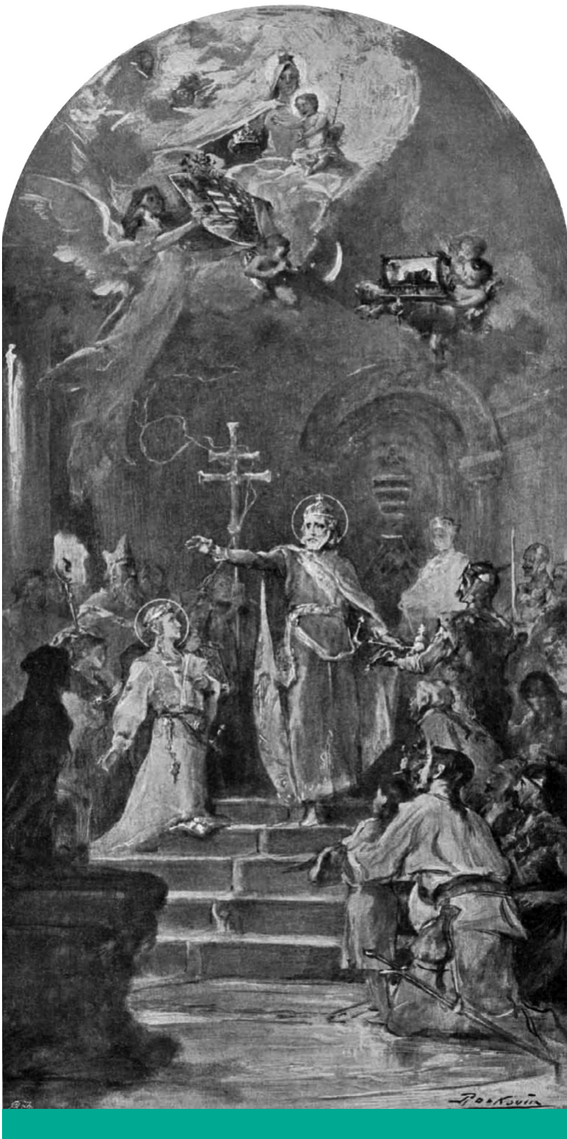
Kulturális keret – Roskovics Ignác vázlata a Szent Zsigmond-kápolna oltárképéről ( Vasárnapi Újság , 1900. 1. szám, címlap)

II. András 1222-ben adta ki a nemesség jogait rögzítő Aranybullát, amely a történeti alkotmányt is megvilágító törvény egyúttal elrendelte Szent István megünneplését. Az 1301-ig Árpád-ház uralta korszak államisága patrimonális monarchiával jellemezhető, vagyis a király akkora földbirtokkal bírt, hogy azal saját kezében tudta tartani a hatalmat, hadsereget állított, a birtokadományozással jutalmazottat pedig bevonta a hatalomba. De ez utóbbi tekintetében