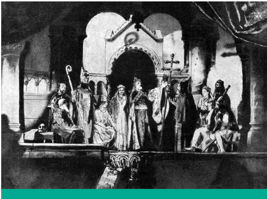
Keresztény állam – Nagy Lázár: Szent István átveszi a kereszténység jelképeit ( Vasárnapi Újság , 1895. 17. szám, 273. oldal)

megjelölésnek nincs befejezettsége, de mégis a múlt, a jelenre és a jövőbeliségre (is) utal. Az „államalkotó kultúrának” egyúttal az államalapító Szent István életművén keresztül saját kultusza is van, valamint a kettő (állam és kultusz) története elválaszthatatlan egymástól.