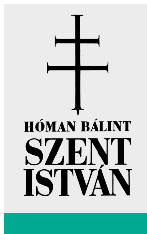
Hóman Bálint: Szent István (1938)

A fogalmi tisztánlátást nehezítette, hogy a modern társadalom térhódítása és a nemzeti (gondolatra vagy) öntudatra ébredések kezdete egybeesett, később a kettő hol keveredett egymással, hol különvált egymástól. Addig a Kárpát-medencei Magyar Királyság lakóit hungarusokként tartották számon, továbbá magukat is így nevezték meg külföldön. Ugyanis – engedéllyel – sok más nép is betelepült az országba, akik megmaradhattak kultúrájuk, nyelvük mellett Szent István „vendégek és jövevények” befogadásáról szóló intése nyomán. Az így keletkezett hungarustudattal vált lehetővé, hogy az egyéb nemzetiségek azonosuljanak a magyarsággal, valamint együttélésük mindaddig zavartalan volt, míg teret nem hódított a nacionalizmus. 42 A vetélkedésre is ösztönző nemzeti eszmék újabb ellenségeskedést szítottak. A valóságban az országok nemcsak egyetlen nemzetet tömörítettek, hanem az adott területen élő más nemzeteket vagy nemzetiségeket, 43 ezért közkeletűvé vált a politikai nemzetállam képzete. 44 A megjelölés tulajdonképpen megfelelt a Magyarországon bevett, korábbi hungarustudatnak . Azonban az uralmi igények igazolására, megtámadására olyan nehezen elválasztható fogalmak születtek a nemzet és állam viszonyában, mint például államnemzet, nemzetállam vagy a másokat háttérbe szorító kultúrnemzet, s innentől kezdve a modern kor történetírását átszötte az egymással (a szabadságért, az önrendelkezésért) versengő kultúrák – népek láttatása.