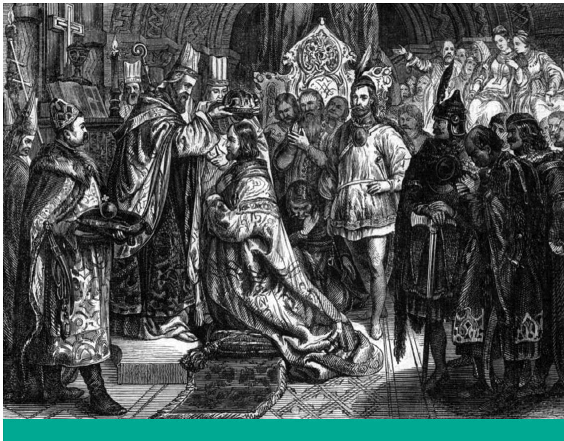
Országalapítás – Peter Johann Nepomuk Geiger: Szent István koronáztatása ( Vasárnapi Újság , 1859. 2. szám, címlap)

a magyarországi eljárás eltért a nyugat-európai hűbériségtől, mert a király a nemzeti vagy patriarchális szemléletből fakadóan az őt körülvevő papokra, vitézekre mint tágabb családjának tagjaira tekintett. A dinasztia fiúági kihálásának korára a lecsökkent királyi birtok már nem volt elegendő az addigi országlásra.