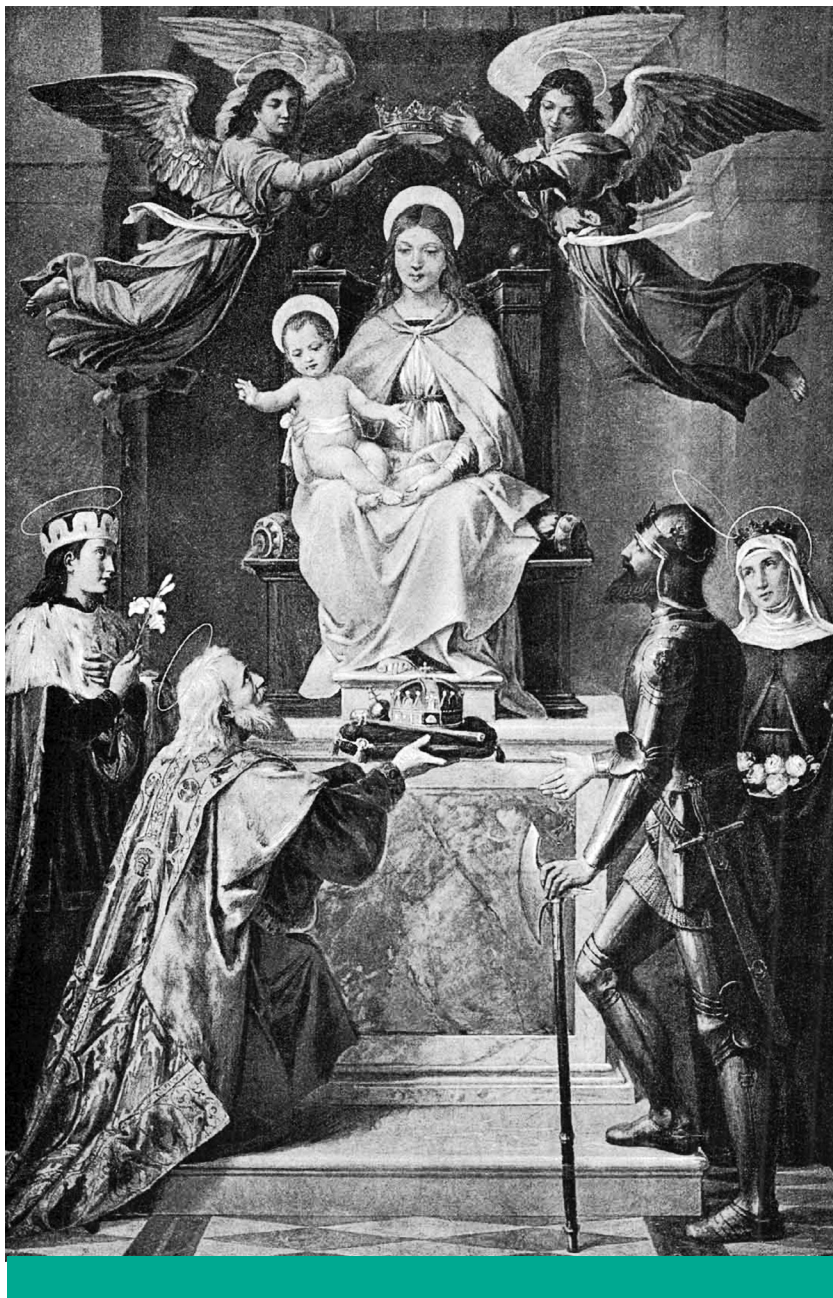
Felajánlás – Szoldatics Ferenc: Szent István a Boldogságos Szűz előtt ( Vasárnapi Újság , 1888. 4. szám, 56. oldal)

évben a keresztény vallásba mentette a közösségkovácsoló erőt, és amely még is meghatározó 61 mint a legkisebb közös erkölcsi alap, amelyre hivatkozva ura lehet önmagának, helyzetének. Az ember létmagyarzó és cselekvésre ösztönző erkölcsiségét vallási tanokból és – számára a saját eszével felfogható világot leíró – logikai tételekből származtatja. A modern szekularizált (és kommercializált) társadalomban a jog – felvilágosodás óta – az igazságosnak feltüntetett alapelvekkel a halandó emberi érdekek csatornázója, és amelyhez a tudományosan is alátámasztott racionális érveket szolgáltatják. A 20. század gondolkodói a 19. század elején különbözően látják az előremutató utat a vallás és az ész összebékítésére. Jürgen Habermas a liberális állam felvilágosult polgárainak toleranciájába, azaz tudatos önkorlátozásába helyezte bizalmát, 62 míg Joseph Ratzinger, a későbbi XVI. Benedek pápa, a két nézőpont képviselőinek közös