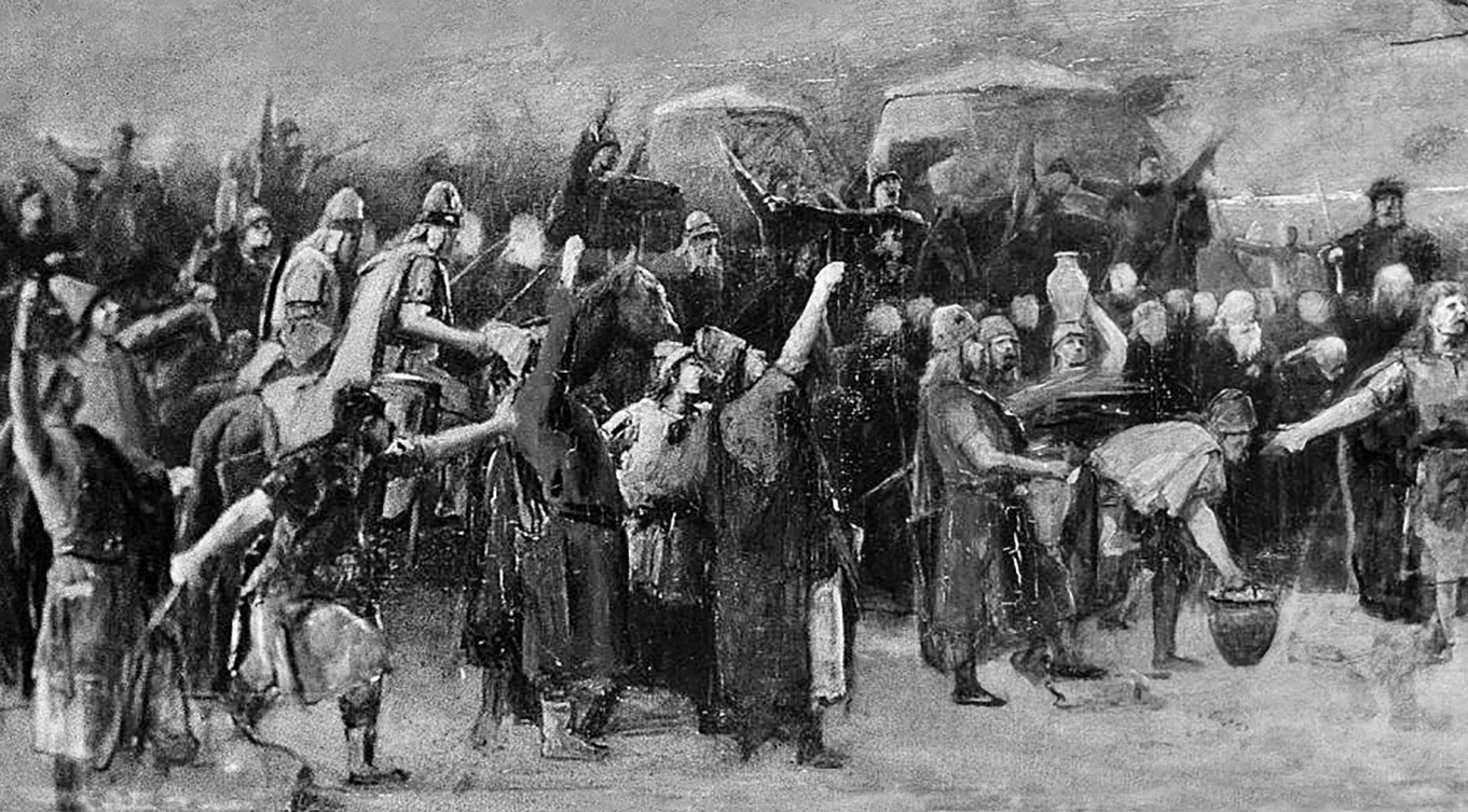
Az állam születése – Munkácsy Mihály vázlatja a Honfoglalásról (1890–93) (Wikimedia Commons)

Az első „nemzetek” tehát aligha a 17. századi angol és holland, mintha a semmiből találták volna fel őket a polgári forradalmak idején és jelennének meg az államtörténet horizontján. 36