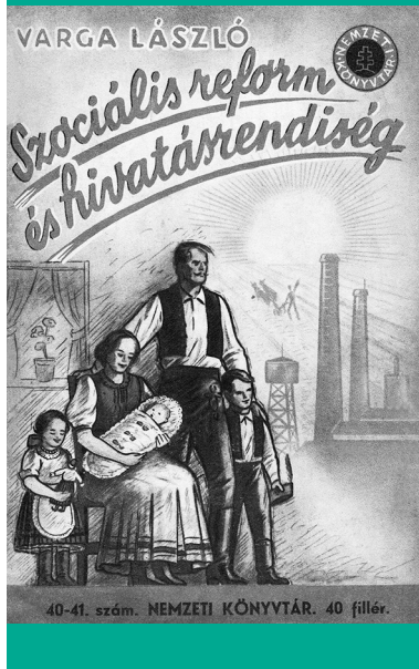
Varga László SJ (1901–1974) emigrációban, és Szociális reform és hivatásrendiség (1941) című könyvének címlapja