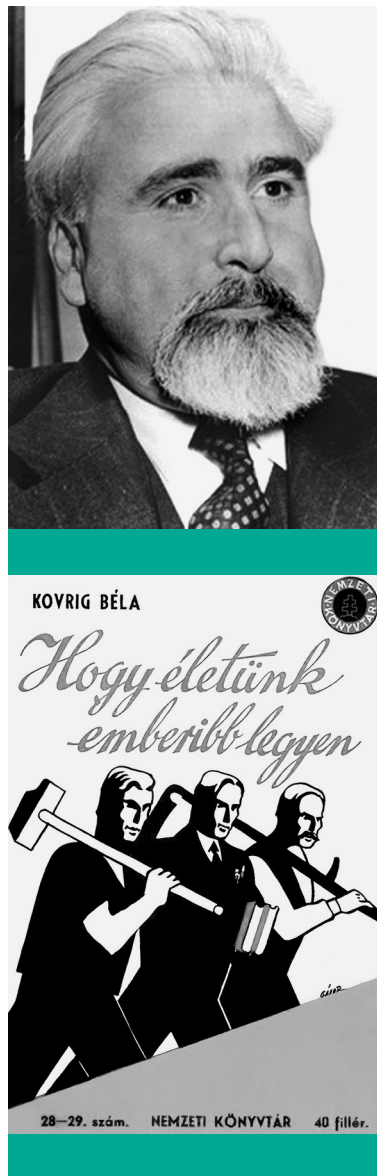
Kovrig Béla (1900–1962) emigrációban, és Hogy életünk emberibb legyen (1940) című könyvének címlapja

Az Actio Catholica (AC) háttérére támaszkodva több kimagasló szervező munkájának köszönhetően jöttek létre a Katolikus Ifjómunkások Országos Egyesülete (KIOE), a mindmáig jól ismert Katolikus Agrárifjúsági Legényegyletek