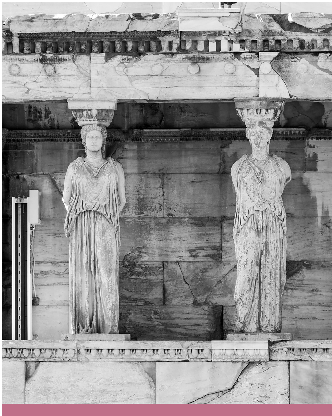
Tartóoszlop – Az Erekhtheion az athéni Akropoliszon (X)

vendégtanáráként dolgozott. Lukács György 1948 nyarán a Társadalmi Szemlé -ben tette közzé írását Kerényiről mint a faszizmus szakértőjéről, aki nem tért haza. Kerényi az ókortudomány és a vallástudomány nemzetközileg elismert tudósa volt. Így vagy úgy a magyar ókortudomány Kerényiből indul ki, legnevezetesebb követője Szilágyi János György művészettörténész, aki egy teljes életrajzi interjút adott a kétezres évek elején. 4 Ebből világosan kiderül, hogy a magyar klasszika-filológia, a klasszikus fogalmának legnagyobb művelői egy helyen, a Lónyay utcai iskolában nevelkedtek. Muraközy Gyula, Devecseri Gábor, Ritoók Zsigmond és mások tették lehetővé, hogy a magyar kultúra antik gyökerei mai hajtásokat teremjenek. Hogy magyarul olvasható és értelmezhető a legtöbb klasszikus ókori mű, abban óriási szerepe volt ennek a szellemi