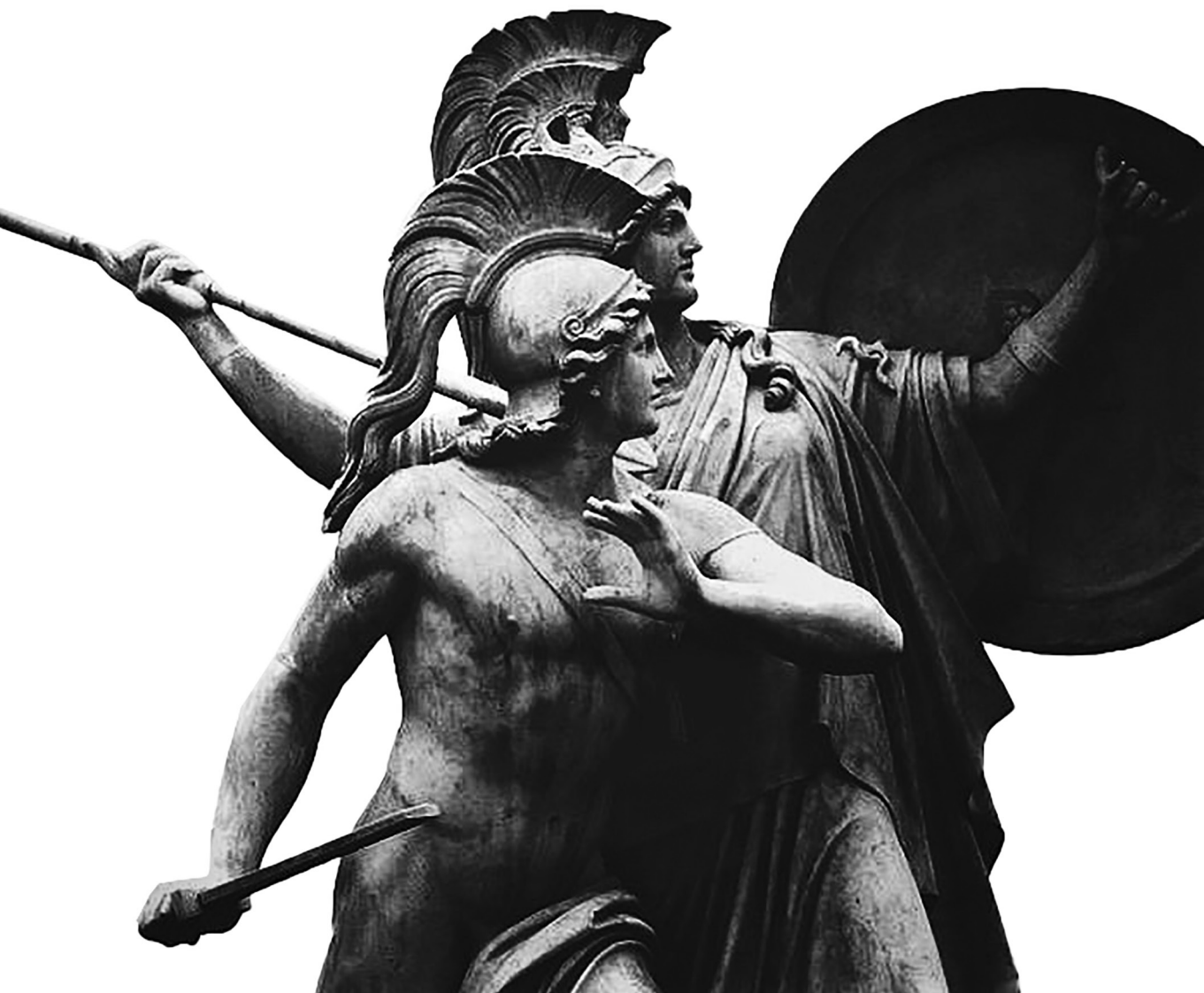
Életégység – Gustav Blaeser: Athéné védelmezi az ifjú hőst (1854) (X)

kialakítva saját céljait és megválasztva az eszközeit és módszereit. Ma sokan úgy tekintenek a szókratészi fordulatra, mint a politikai gondolkodás, elmélet vagy filozófia megszületésének aktusára. A megnevezés nem teljesen mellékes, mivel a „gondolkodás” sokkal több mindent magában foglal, beleértve a hétköznapi véleményalkotás végeredményét, a politikusok beszédjeit, de a teoretikusok akadémiai munkáit is. Ezzel szemben a politikai filozófia filozófiai szempontból tanulmányozza a politikát.