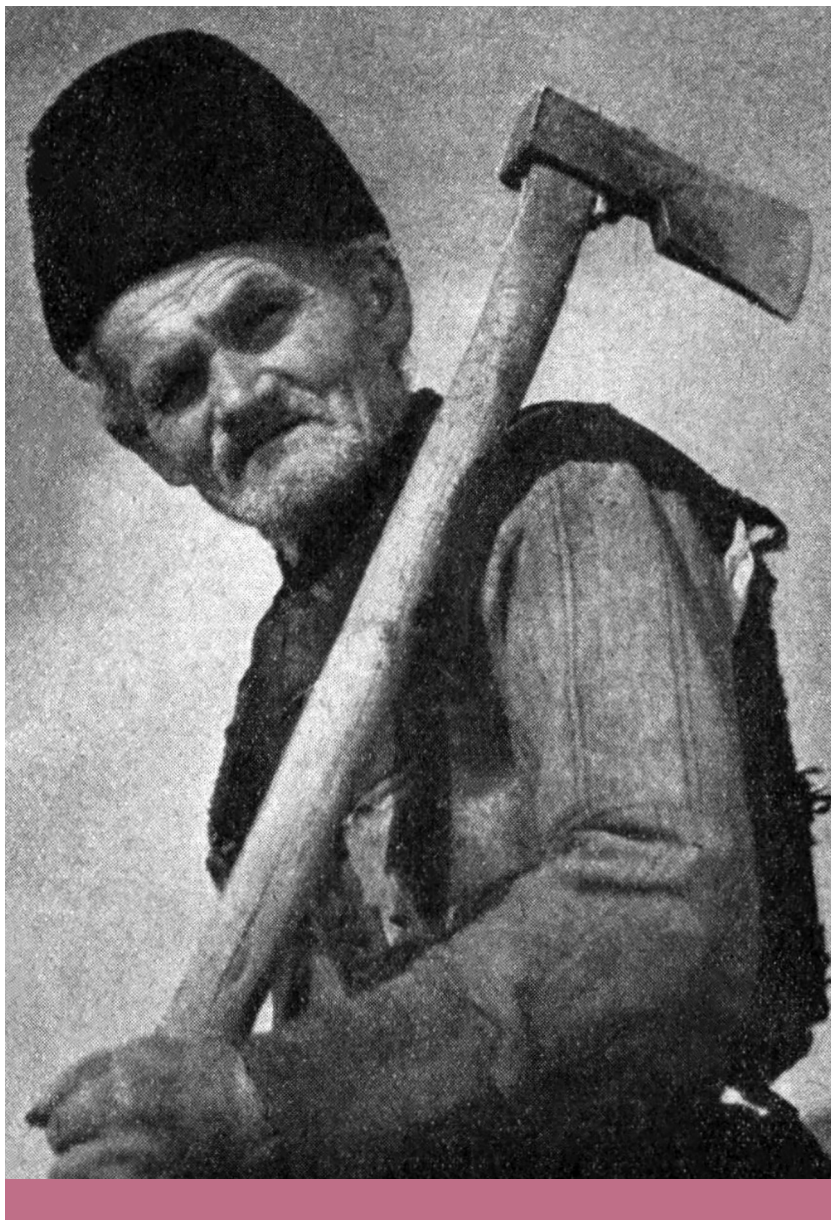
Népi arc – Korabeli képillusztráció Fekete István Gyeplő nélkül című regényrészletéhez ( Új Idők , 1946. 40. szám, 689. oldal)

ségében bízott, a merkantil (iparpártoló) érdekekkel szemben – ez meg érthetővé teszi, miért nem vált Fekete népi íróvá. Fekete harmonikusnak látta (alapvetően) a mezőgazdasági munkás és munkáltatója kapcsolatát, és ha valakit hibáztatott a szociális reformok elmaradásáért, az az iparnak kedvező lobbierdek volt.