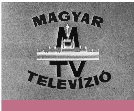
Az MTV vörös csillagos emblémája 1961–69 között