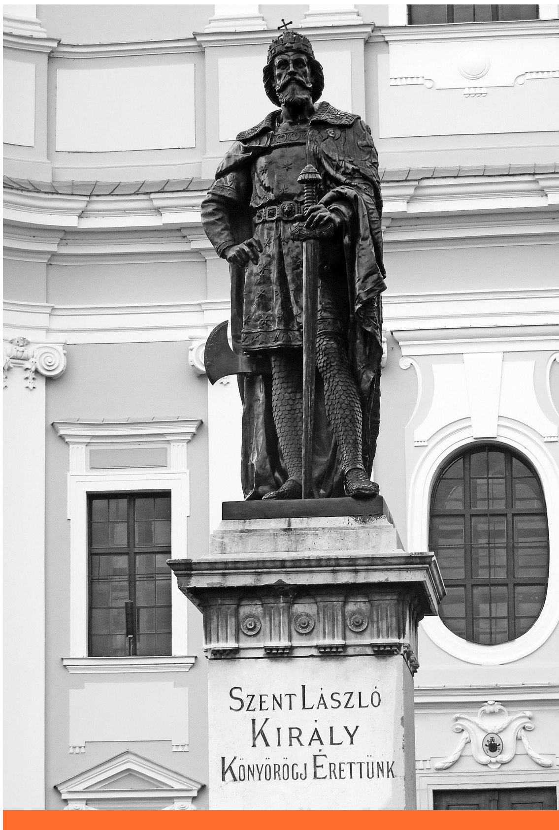
Lovagkirály – Szent László szobra Nagyváradon

emeli, hogy új szempontokat adhat a hősepika kutatásához az ikonográfiai, művészettörténeti adatok (miniatúrák, illusztrációk) – köztük orosz, bizánci és itáliai anyagok – bevonása.