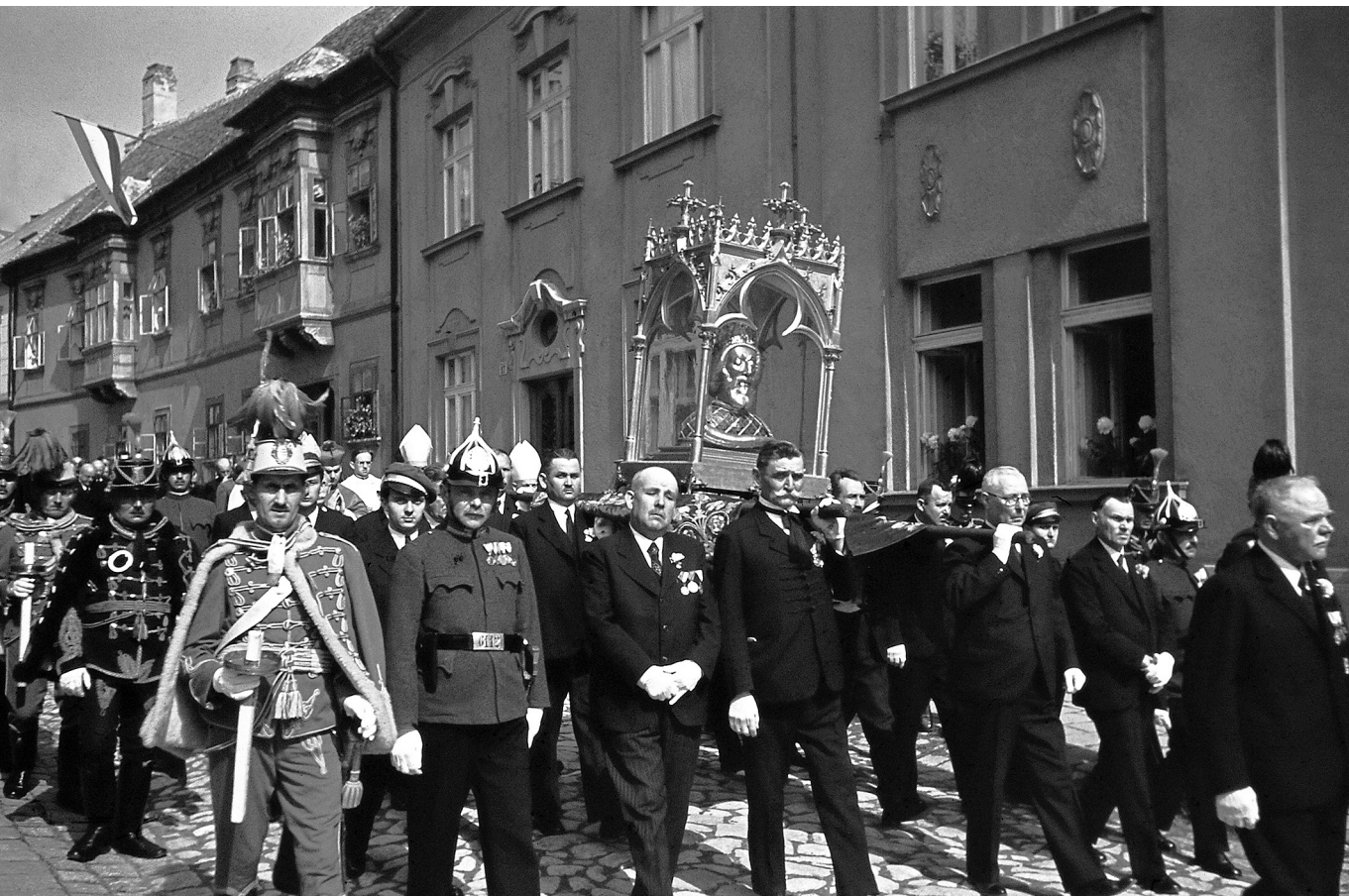
Segedelem – Szent László-napi körmenet a Szent László hermával a győri Káptalandombon, 1939

kezelik az orosz és a finn mitológiaiakutatók. Ugyanakkor itthon a magyar kutatók között csak félve lehet kimondani annak ellenére, hogy a magyar néphit, a népdalok és a népművészet szimbolizmusa, a népmesék és a mondák motívumai, a szólások, a helynevek esetében ugyanúgy használható (és megfejtendő) információt tartalmaznak, mint a szláv, lett, litván, észt és finn kultúrában. [...] A mitológia az egyik legidőtállóbb mentális reprezentáció, amely képes ellenállni a legradikálisabb történelmi változásoknak... A mitikus hagyományok életét az jellemzi, hogy alapvetően konzervatív az alkotó elemek szerkezetét és azok témáit tekintve.” 27