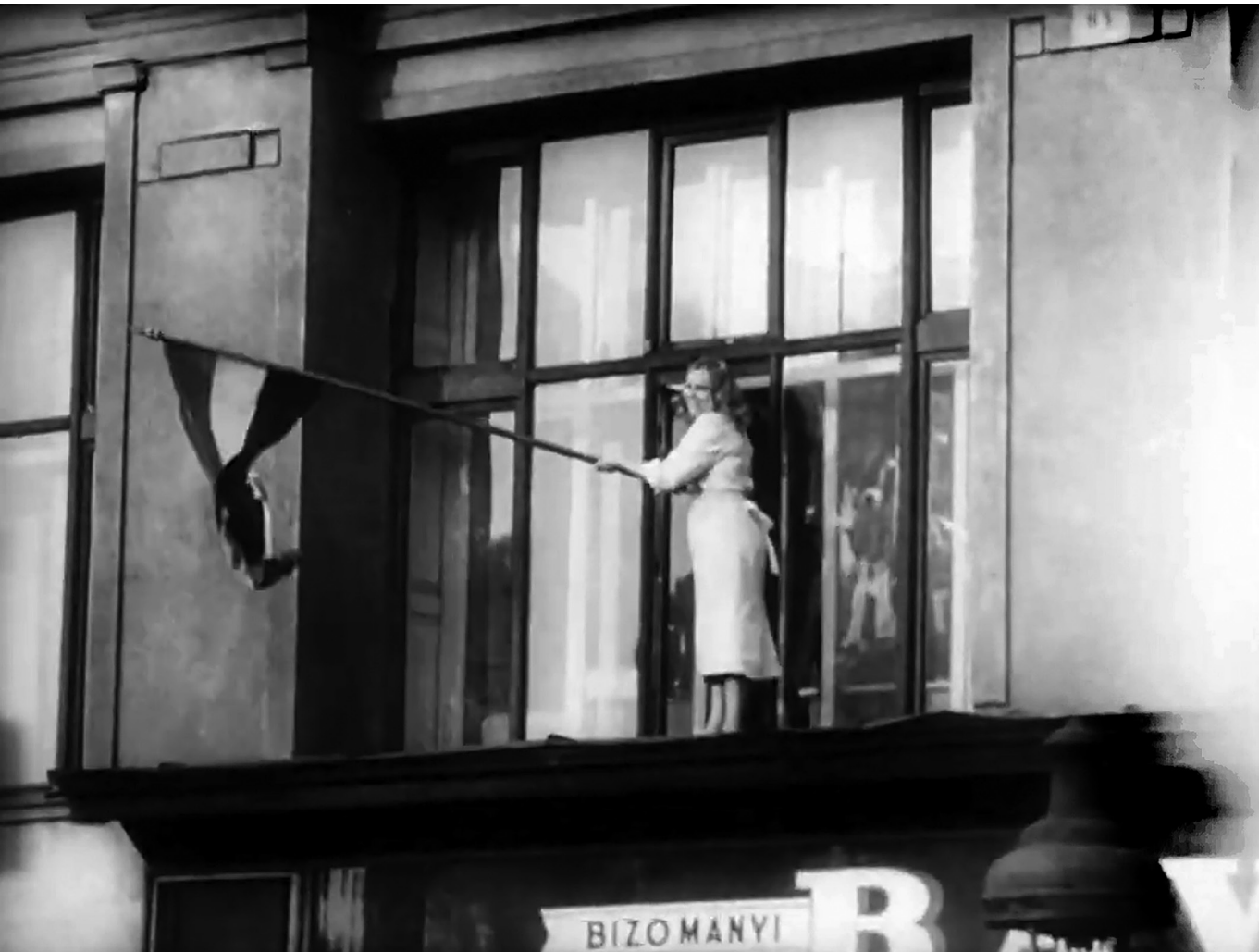
Nemzeti ablak a világra – Magyar lobogó az Anker-ház erkélyén, 1956. október 23.

szerezte a legtöbb mandátumot, szám szerint 15-öt, a Fidesz tízet (a KDNP egy képviselője a választások előtt még az Európai Néppárt frakciójában ült), a lengyel Konföderáció és a német Saha Wagenknecht Szövetség hatot-hatot, míg a szlovák SMER öt helyet szerzett az EP-ben, hogy csak néhányat említsünk. 12