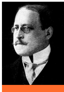
Bettelheim Sámuel (1872–1942)

1908-ban Pozsonyban alapított német nyelvű cionista lapot Pressburger Jüdische Zeitung , majd Budapesten Ungarländische Jüdische Zeitung néven, előbbi egy évet élt, utóbbi 1910 és 1915 között jelent meg. A kettő között, 1910-ben