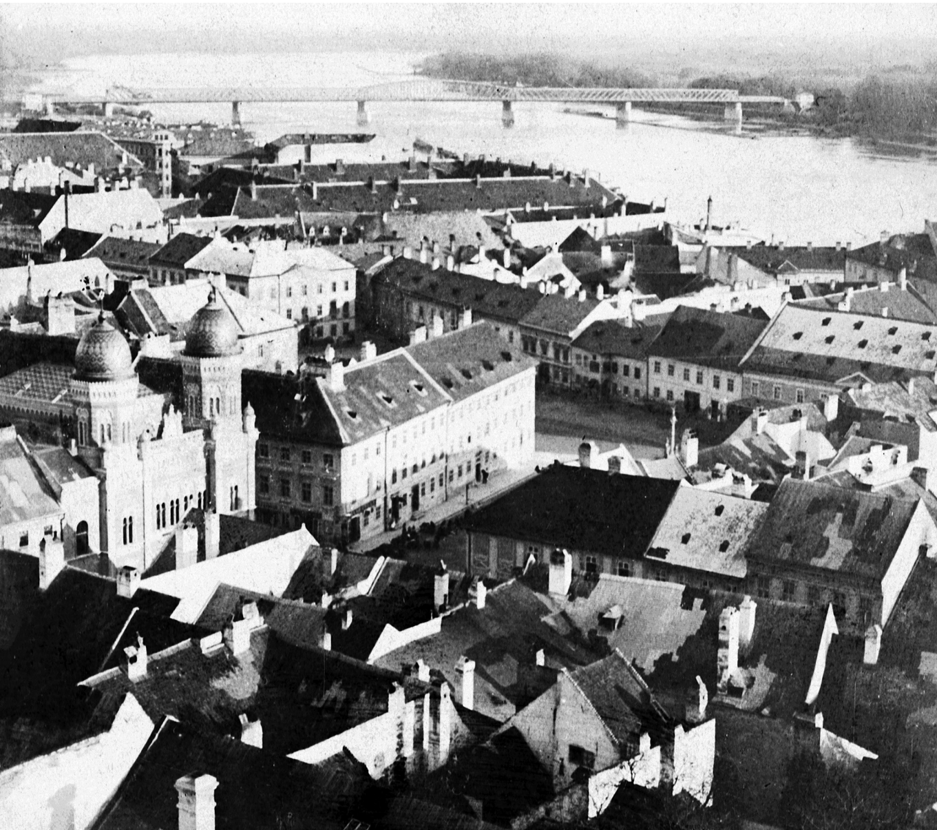
Békebeli – Pozsony látképe, balra a Hal téri neológ zsinagóga, 1900

cikk szerint a cionisták között ellentmondásosabb dolog volt együttműködni a Népszavával , mint Szabó Dezsővel). 14