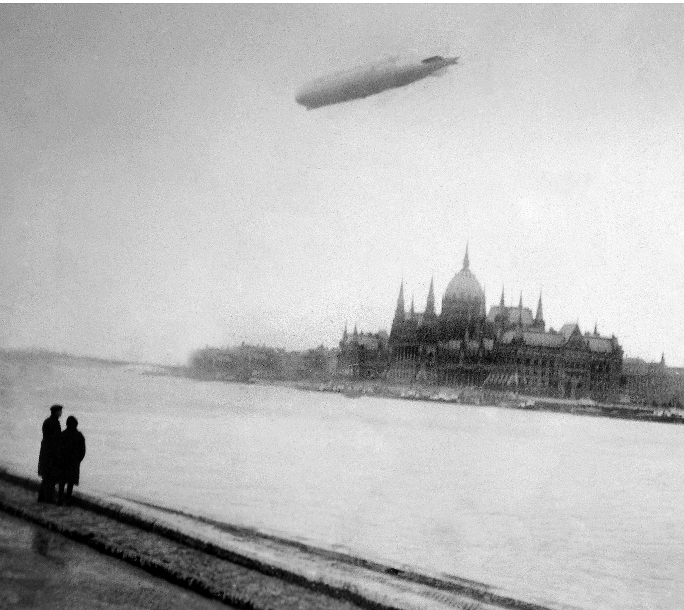
I want to believe – Graf Zeppelin típusú léghajó az Országház fölött, 1931

kezdeté óta a család feladata és felelőssége volt, ma, a család hanyatlásával, az iskolától vár. Utóbbiaknak pedig azért, mert az osztálytermekeket nem aszerint szerelik fel, hogy milyen eszközökre van valóban szükség a gyermeki agy és lélek fejlődéséhez (jórészt semmilyenre), hanem aszerint, hogy milyen termékeket erőszakol rájuk (akár széles mosollyal átadott kormányzati beszerzéseken keresztül) a jövő felnőtt felhasználóira vadászó nagyvállalat. A két típusú nyomás eredménye a túlterhelt, alapvető feladataira összpontosítani képtelen pedagógus és a tanulásra alkalmatlanná tett diák. A modern iskola valójában gyárépület – az ember azonban ettől még nem vált nehézipari alapannyaggá. A padsor, mint gyártósor, hatékony nem lehet.