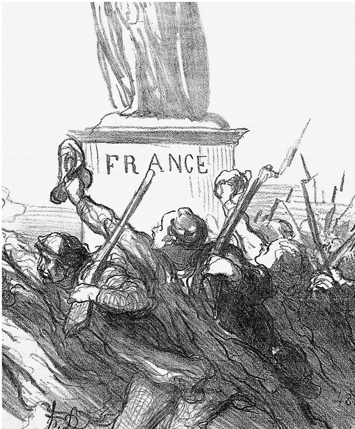
Nemzeti forradalom – Honoré Daumier Üdvözlnek a halálba menők című rajza a porosz–francia háború idején, 1870 (Szépművészeti Múzeum)

mindig akad egy-egy kisközepes frakció, hogy aztán mindkettő alulmaradjon a túloldalon így vagy úgy, de a végén mindig összefogó liberális–baloldali blokkal szemben. A három jobboldalba most is behelyettesíthetők a Republikánusok, Le Pen asszony Nemzeti Tömörülése és a Zémour-féle Rekonkvizsta.