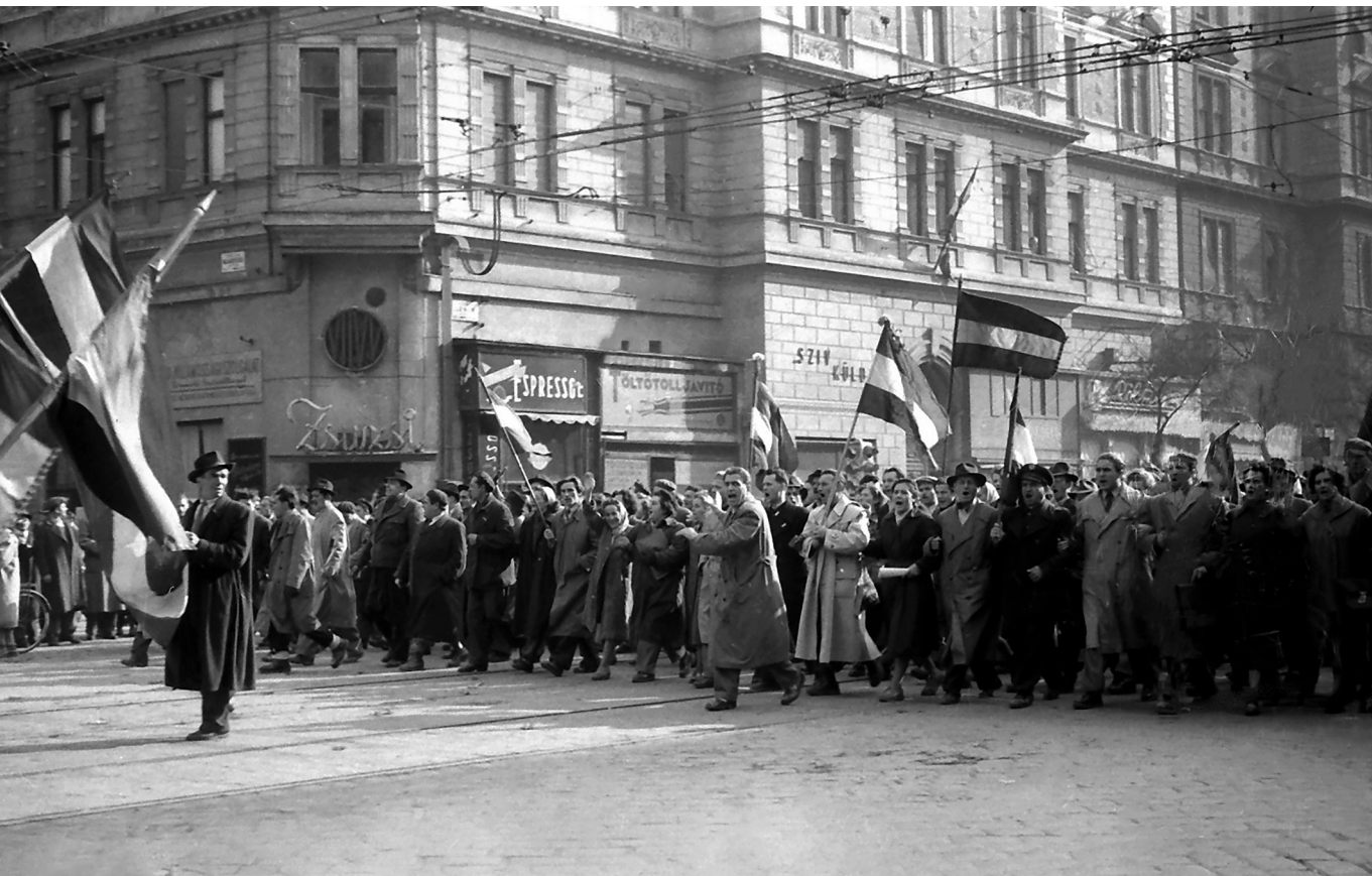
Nemzeti egység – Budapesti tüntetés az 1956-os forradalom idején a mai Erzsébet körút és a Király utca sarkán

általánosabb ontológiai-antropológiai jellemzőkkel, a konzervativizmus, mint konzervativizmus, időhorizontja igencsak behatárolt. Ha van is általában vett, öröknek tételezhető Konzervativizmus, akkor annak csak időleges szakasza az a konzervativizmus, amely kitüntetetten a felvilágosodás és a francia forradalom ellen hadakozva forradalomellenes vagy egyenesen ellenforradalmi jelleget öltött. A görög gondolkodó esszéje végén erősebben is fogalmaz, és azt írja, hogy mint ideológia, a 18. század végi, 19. század elejei konzervativizmus az addig uralkodó csoportok hatalmának megtartását védelmezte, mégpedig az állam és egyház elválasztása és a gyáriparnak a mezőgazdaság fölébe kerekedése ellenében, vagyis a szekuláris industrializmus – vereséget szenvedett – ellenzékéként szolgált. Mint ilyen, „a konzervativizmus történelmi tartalma kimerült”, így pedig a társadalom- és eszmetörténet antikvárius érdeklődésén kívül nem tarthat számot aktuális vonatkozásra, legföljebb „metaforikus vagy polemikus-apologetikus értelemben”. 19 Ennyiben a „konzervativizmus” a jobboldal gyermekbetegsége.