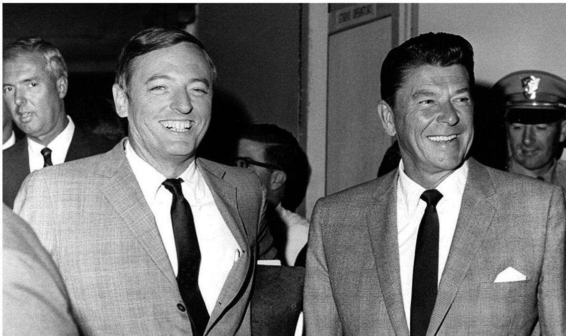
Fúzió – William F. Buckley Jr. lapszerkesztő és Ronald Reagan kaliforniai kormányzó 1967-ben

mag körül elrendezve teszi. Ebből két további dolog következik: az első, hogy alapvetően a természetes szövetségesekre kell koncentrálni, aztán keresni a szabad vegyértéket, a második pedig, hogy a szövetségi rendszer magvaul egy szellemi és politikai szempontból, de azt is mondhatnánk, hogy kulturális és társadalmi tekintetben egyaránt vezető erő szolgál. Amint Antonio Gramsci fogalmazott letartóztatása előtti utolsó, már kéziratban maradt írásában, amely A déli kérdés néhány aspektusa címet kapta, egy csoport, adott esetben éppenséggel az észak-olaszországi munkásság, „oly mértékben lehet vezető [...], amilyen mértékben sikerül megteremtenie az osztályszövetségek rendszerét”, ehhez pedig az kell, hogy más osztályok, speciálisan a délolasz parasztság érdekeinek képviselőjét is vállalja, bizalmukat elnyerje és támogatásukat megszerezze. 2 Ez már átvezet minket a szövetségi politika és az országos politika területén egyaránt használatos legfőbb fogalomhoz, azaz a hegemoniához, amely úgy az együttműködő társadalmi csoportok, azaz a „történelmi blokk” tagjai között, mint az egész nemzet fölött értelmezhető, és közelebből a politikai uralom és a szellemi vezetés szerves egységét jelenti. Jó, ha tudjuk, hogy „a hegemonia létrejöttének feltétele a vezetésre való képesség – a konszenzus elnyerésének értelmében”. 3 A hegemoniának ez a létfontosságú összetevője alakítja ki a Gramsci által megfogalmazott „politikai-szellemi fölényt” kettősét. 4