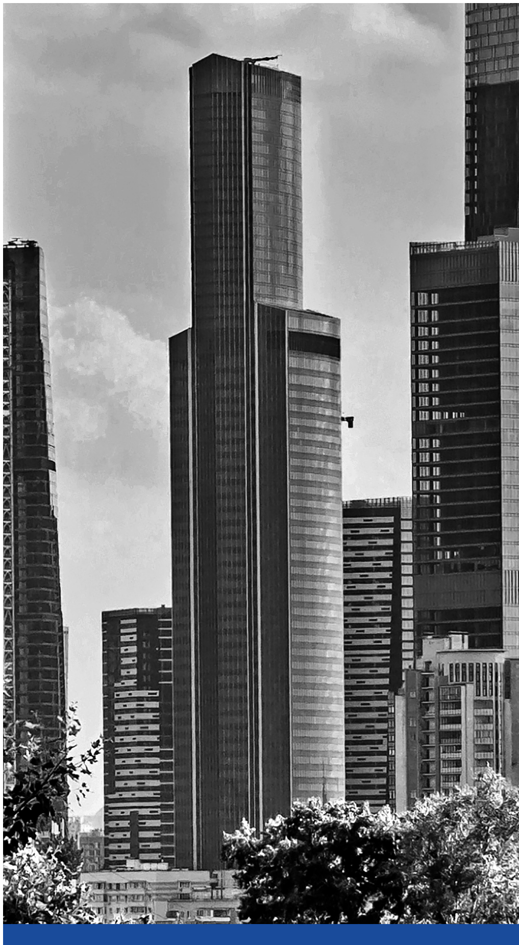
Toronyiránt – A 309 méteres, 2006 és 2014 között épült Eurázsia felhőkarcoló Moszkvában ( Wikimedia Commons )