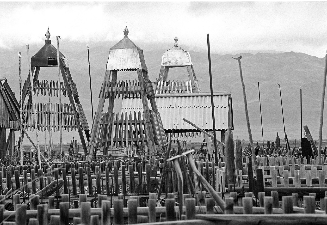
Ázsiai hagyomány – Kazah temető 2012-ben

rendre vonatkozó felhívásait. A konferencia arra is törekedett, hogy újjáéledjen az az Ázsia régiói közötti kulturális, kereskedelmi és diplomáciai cserekapcsolat-ökoszisztéma, amelynek meglévő mintáit különösen a 18. század végétől kezdve az ázsiai országok külső diplomáciai és kereskedelmi kapcsolatainak monopolizálására törekvő európai hatalmak államvezetési igényeinek rendelték alá. A felhívással az érdemibb együttműködésre az ázsiai résztvevők nem csupán azt remélték, hogy megfordítják a kikényszerített közpolitikai megosztottságukat; inkább egy olyan új nemzetközi rend kialakításában bíztak, amely az ázsiai együttműködés horizontálisabb formáin alapul, nem pedig vertikális alá-fölérendeltségi viszonyokon. A bandungi résztvevők tehát messze nem egyszerűen a nyugati dominanciájú renddel való, saját feltételei alapján történő kapcsolódásra törekedtek, hanem arra, hogy újjáélesszék és újjáteremtsék Ázsiát a nemzetközi diplomácián és a világ gazdaságon belül, helyreállítva a nyugati hegemoniát megelőző, egyenlőbb civilizációközi kereskedelmi rendet. 14 Ez volt Bandung rendépítő aspektusa.