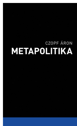
Czopf Áron: Metapolitika (2024)

A válasz nem másutt, mint a politika előtti, tehát metapolitikai térben található, ez a tér azonban nem annyiban politika előtti, hogy időben előzné meg a politikát (ahogyan azt a metapolitika német iskolája vallotta), hanem annak előfeltételeit adja. Ez azonban a metapolitikának csupán az egyik lehetséges definíciója a szerző szerint, és emellett két másikat is megnevez. A második meghatározás szerint a metapolitika a „megelőző kegyelem” hatása a politikai cselekvésre, a harmadik szerint pedig az igazság és hatalom között vonható legrövidebb egyenes. Bárhogy is legyen, a metapolitika egy újabb köztesség,