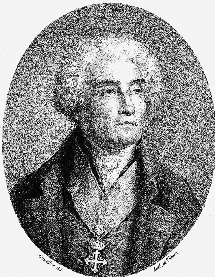
Le Comte Joseph DE MAISTRE