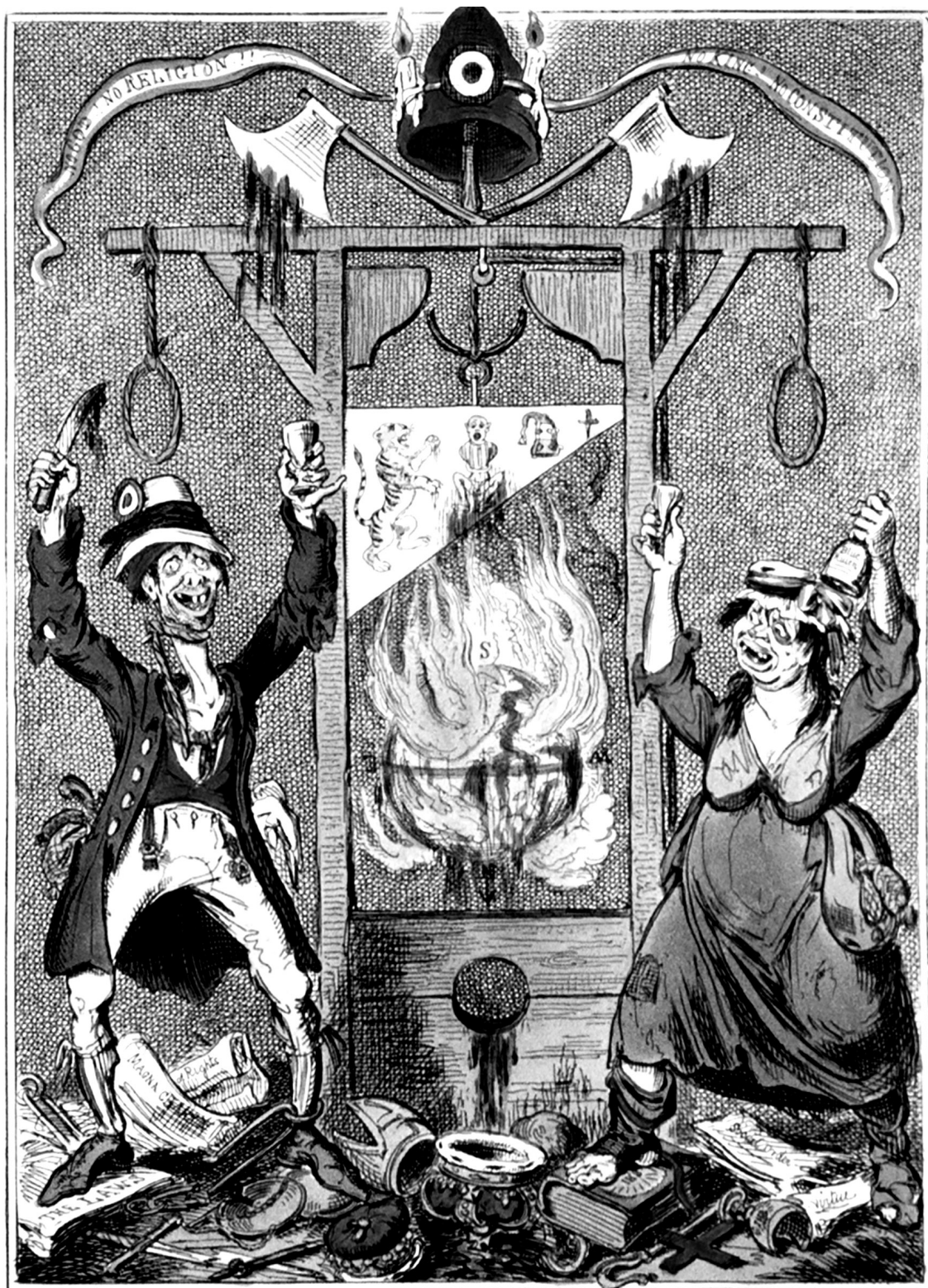
The Radical's Arms

Egyenlősítők – Szatirikus ábrázolás a francia forradalomról, 1819