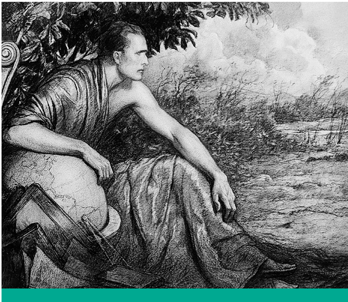
„Messze jövővel komolyan vessz össze jelenkort” – Wladyslaw Theodore Benda grafikája, 1917

egy társadalom haladónak vélt célkitűzése ugyan megvalósul, ám az eredmény összességében nem javulást, hanem romlást hoz (például a kommunizmus vagy az ökológiai válság esetében). A tudatos célkitűzések nélküli változások lehetnek kedvezőek (mint az internet elterjedése) vagy károsak (mint a klímaváltozás), de ezek nem teleologikus folyamatok eredményei. A legfontosabb haladási kudarcot tehát a pusztító haladás jelenti, ahol magának a telos nak a bekövetkezése vezet végzetes következményekhez. A másik két eset, azaz a spontán javulás és romlás a szó szűkebb értelmében nem tekinthető haladási kudarcnak, hiszen a teleologikus cél nem valósult meg. Ennek ellenére érdemes rámutatni arra, hogy a társadalmi haladás esetenként tudatos folyamatok hiányában vagy éppen azok ellenében is bekövetkezhet.