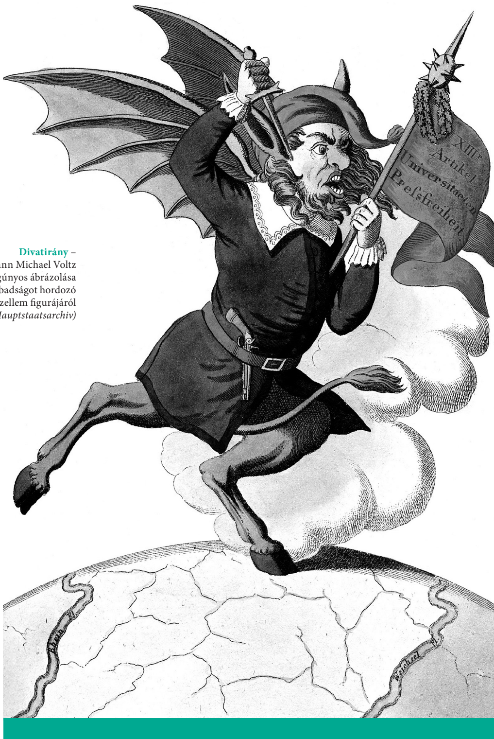
Divatirány – Johann Michael Voltz 1819–20-as gúnyos ábrázolása a sajtószabadságot hordozó korszellem figurájáról

programjuk középpontjában a radikális egyenlőség állt, amelyet nemcsak jogi, hanem gazdasági értelemben is érvényesíteni kívántak. A jobboldali girondisták mérsékelték voltak: tiszteletben tartották a magántulajdont, a piacgazdaságot, valamint a felvilágosodás olyan alapértékeit, mint a törvény előtti egyenlőség, a hatalommegosztás, a szólás- és vallásszabadság. 12