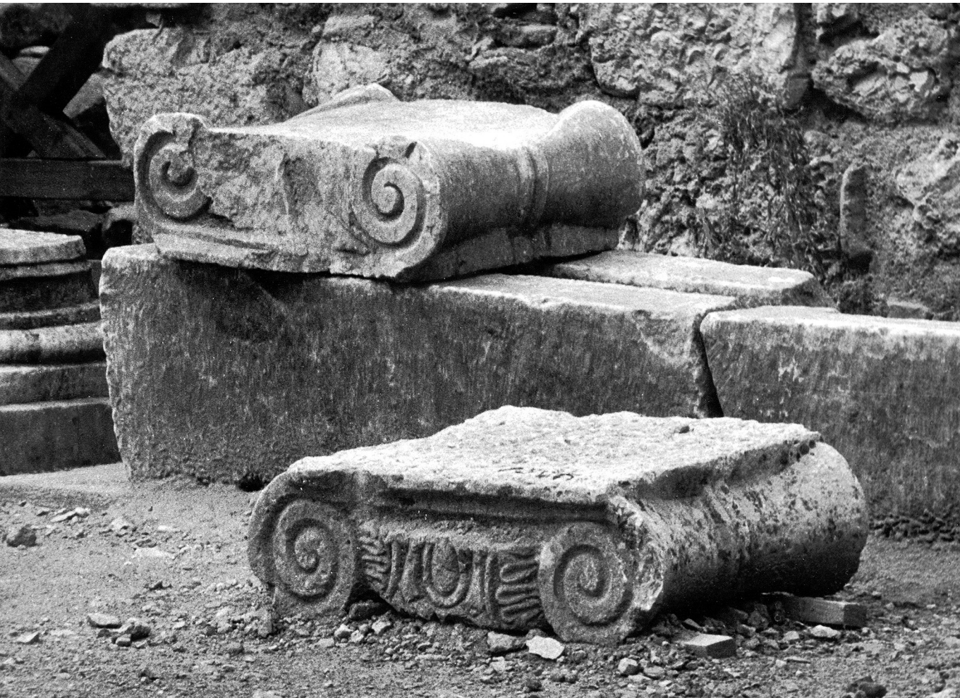
Fő oszlop – A delphoi szentély templomromja