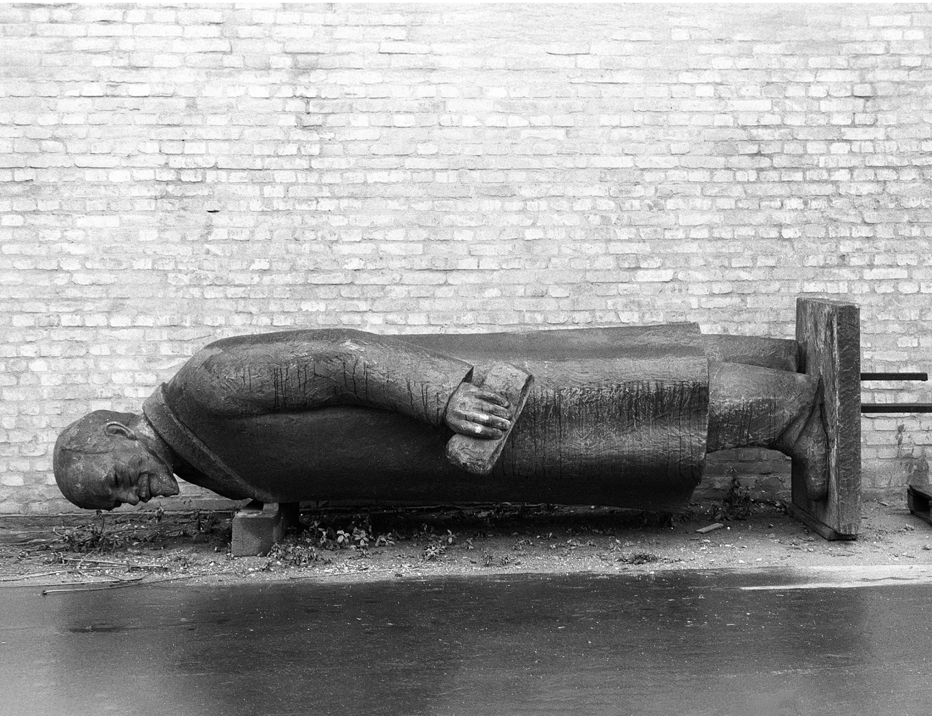
Elfekvő – Pátzay Pál 1965-ben készített és 1990-ben leszerelt Lenin-szobra

kell a fájdalommentes életet, ami alapvetően egy mesterséges, a természettel szemben kialakított és ember által uralt életformát jelent. A természettel szemben kialakított életforma az egyenlőség eszméjének normatív érvényesítését kívánja meg. Az egyenlőség eszméje csinos, de végzetes eszme az emberi életre. Nem arról van szó, hogy az élet egy-egy területén ne volna hasznos és helyeselhető az egyenlőséget alkalmazni (például a joggyakorlat tekintetében), de az életforma egészét ennek alávetni tévedés és káros.