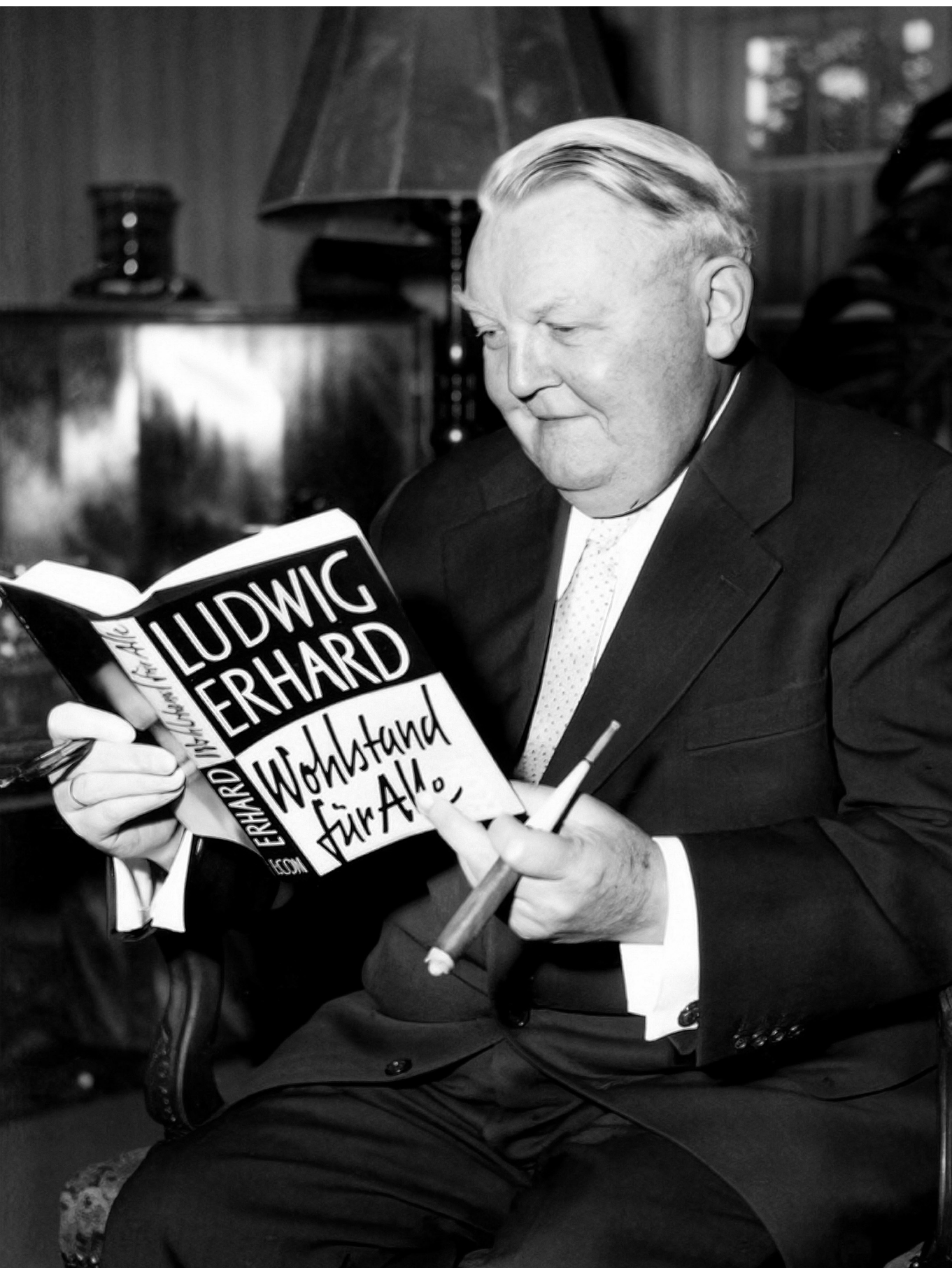
Ludwig Erhard, a nyugatnémet gazdasági csoda atyja saját, Jólétet mindenkinek (1957) című könyvével