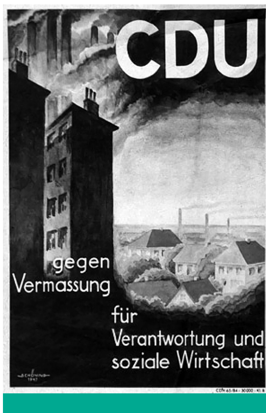
Gazdasági csoda – A CDU szociális piacgazdasággal kapcsolatos választási plakátjai 1949-ben

és a munka közötti történelmi egyensúlytalanság korrekcióját helyezi a középpontba. Thomas Piketty A tőke a 21. században (2013) című korszakalkotó művében empirikusan bizonyította, hogy szabályozatlan kapitalizmusban a tőkejövedelmek gyorsabban nőnek, mint a gazdaság egésze, amely dinamika beavatkozás nélkül a társadalmi szövetet szétfeszítő, fenntarthatatlan egyenlőtlenségekbe torkollik. 31 Mivel ez a dinamika spontán piaci mechanizmusokkal nem fordítható vissza, a patrióta stratégia a munka értékének tudatos, állami eszközökkel történő növelését írja elő. Az agresszív minimálbér-politika ebben az értelemben több mint segély: valódi gazdaságfejlesztési eszköz, amely kikényszeríti a technológiai fejlesztést az alacsony hozzáadott értékű termelés helyett, és biztosítja, hogy a GDP növekedése a bérszínvonalban is tükröződjön. Ezzel párhuzamosan a nemzeti szuverenitás védelme megköveteli a centrum–periféria viszonyok újrendezését. Gabriel Zucman kutatásai rávilágítanak az adóparadicsomok nemzetromboló szerepére; 32 a keep balanced elve ezért egy olyan „egyenlősítő államot” feltételez, amely megakadályozza a profit kivitelét, valamint biztosítja, hogy a megtermelt jövedelem a helyi társadalmat gazdagítsa, vagyis ott hasznosuljon újra, ahol keletkezett. A helybeli hasznosulás fontosságáról már Adam Smith is említést tett korábban hivatkozott korszakalkotó, tudományterületet megalapozó művében.