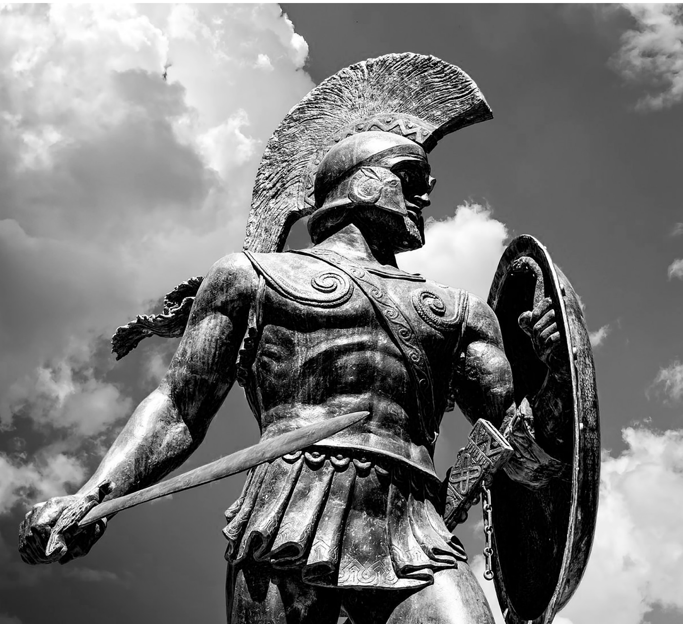
Európai idealizmus – Leonidász spártai király szobra (X)

„különvagonét”. 2 Több Schmittre, Deneenre és Sombartra, kevesebb Hayekre, Yarvinra és Mileire van szükség; több rendre, kevesebb káoszra; több teljesítményre, kevesebb pókerjátékra.