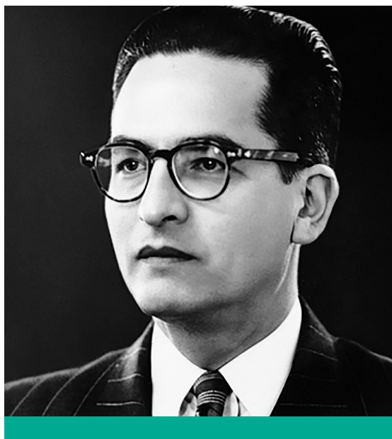
Karlista gondolkodók – Jaime Balmes (1810–1848), Juan Donoso Cortés (1809–1853), Juan Vázquez de Mella (1861–1928) és Elías de Tejada (1917–1978)

a modern politikai irányzatokat közös gyökérre vezette vissza, mégpedig a transzcendencia tagadására, amely elkerülhetetlenül a politikai rend felbomlásához vezet. 21 Bár ő maga nem azonosult maradéktalanul a karlizmussal, gondolkodása döntő módon járult hozzá ahhoz a fogalmi készlethez, amely a karlista szerzők számára lehetővé tette a modernitás politikai válságának átfogó értelmezését.