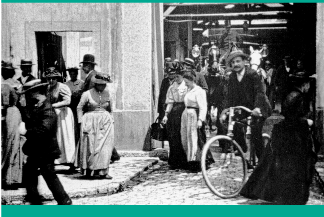
„A munkának vége, kijössz a gyárból” – Képkockák a Lumière testvérek A munkások elhagyják a gyárat , más néven A munkaidő vége (1895) című filmjéből (IMDB)

A korábbi, egyértelmű munkásosztály-alapú baloldal, például amelyet a Lumière testvérek filmje, a Munkások elhagyják a gyárat (más néven: A munkaidő vége , 1895) reprezentál, mára elvesztette szubjektumát. A Lumière-film-ben, amelyben egyébként a munkások a Lumière-gyárat hagyják el, tökéletes összhangban van a médium és a tartalom: a film immanens, lineáris idősíki, tehát a forgó filmszalag A-ból vezet B-be, mint ahogyan egy futószalagnak is van teleológiája, és Marx is Hegel teleologikus történelemkoncepcióját vette át. Tehát úgy, mint ahogy a filmszalag és a futószalag forog, a munkások viszik előre a történelmet, már ha marxistaként gondolkozunk. (Szerintem egyébként valójában a Lumière testvérek, a film készítői vitték előre a történelmet.)