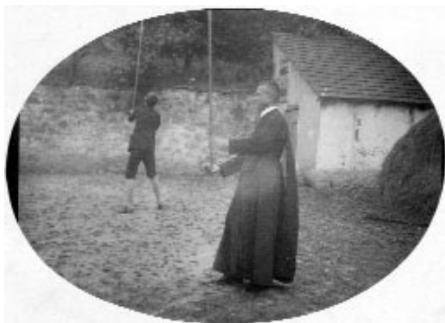
Egyensúly (Kováts Asztrid hagyatékából, 1910 körül)