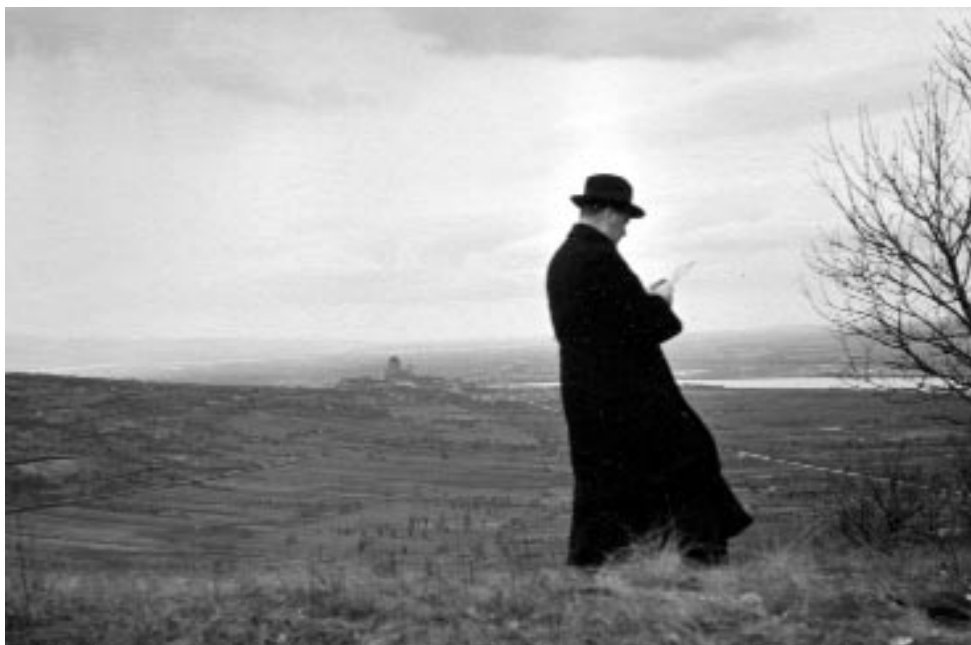
Elfordulás (Poroszlai Valérián hagyatékából, 1940 körül)